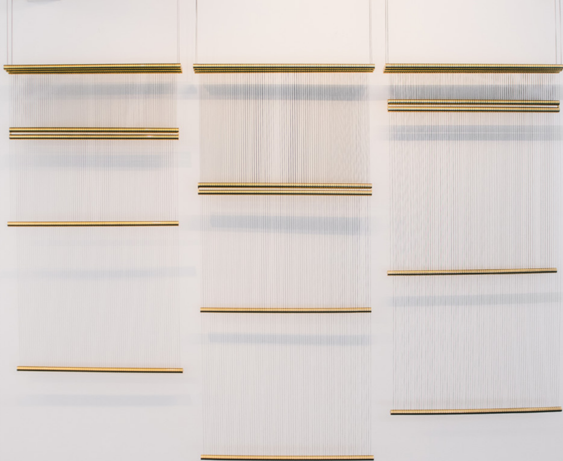
Ascensor # 08 , 2020 latão e linhas de multifilamento brass and multifilament lines edição única/unique 110 x Ø 12 cm/43.3 x Ø 4.7 in