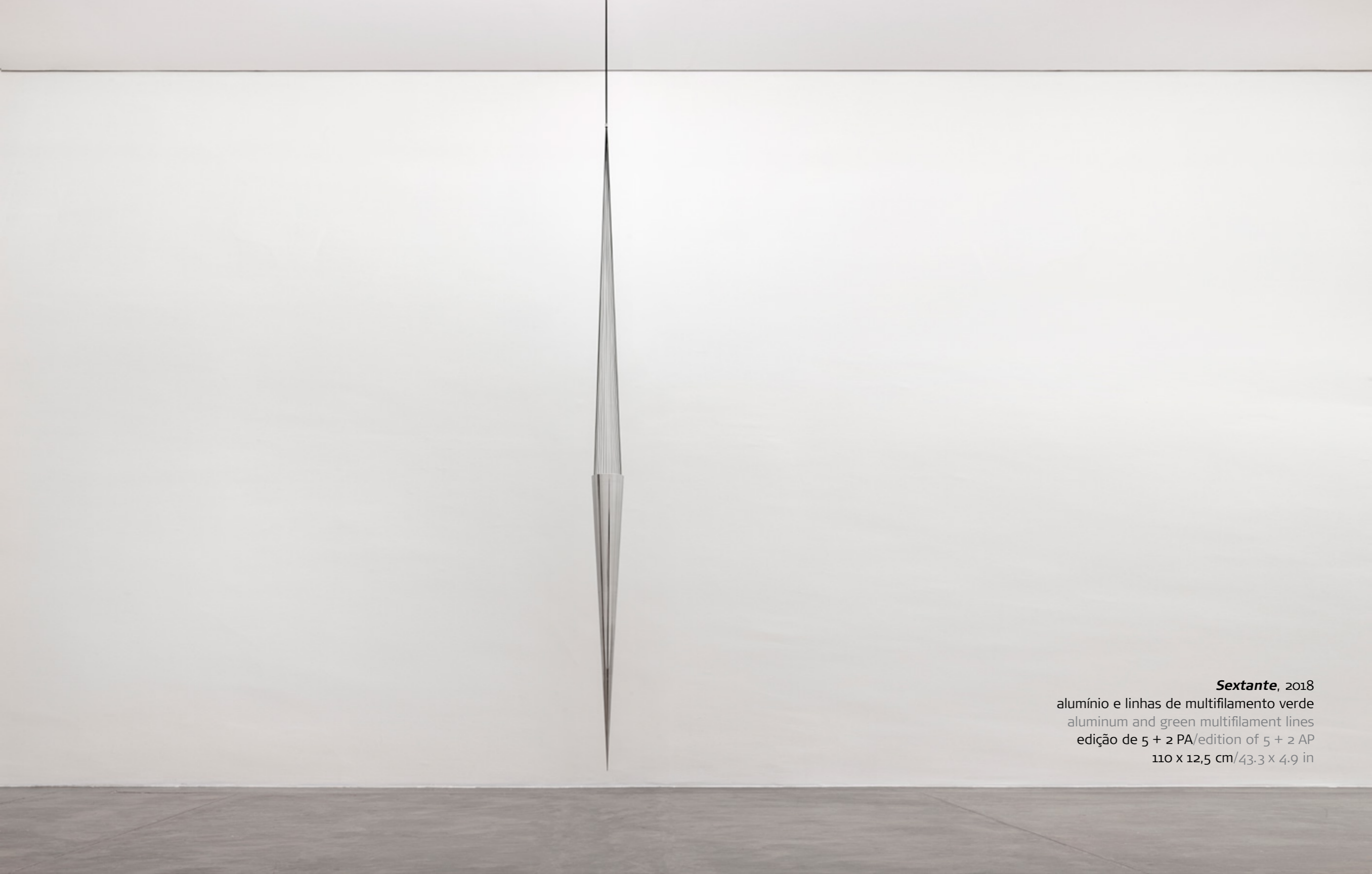
Sextante , 2018 alumínio e linhas de multifilamento verde aluminum and green multifilament lines edição de 5 + 2 PA/edition of 5 + 2 AP 110 x 12,5 cm/43.3 x 4.9 in