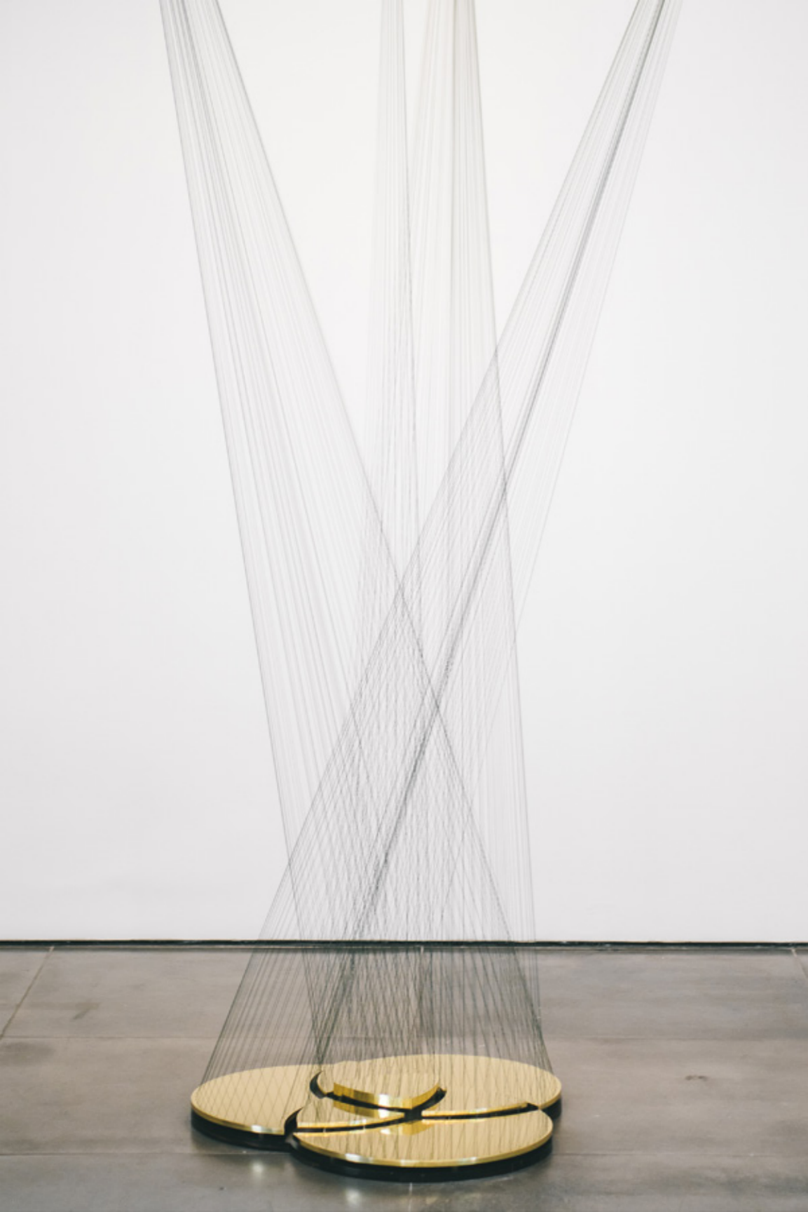
Inverso do infinito , 2020 latão e linhas de multifilamento brass and multifilament lines edição de 5 + 2 PA/edition of 5 + 2 AP dimensões variáveis/variable dimensions