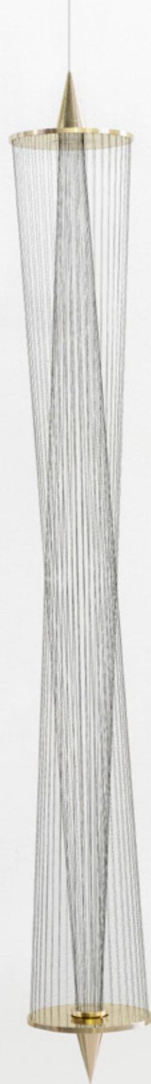
Pablo , 2019 latão, linhas de multifilamento verde e cabo de aço brass, green multifilament lines and steel cable edição de 5 + 2 PA/edition of 5 + 2 AP 200 x Ø 25 cm/78.7 x 9.8 in