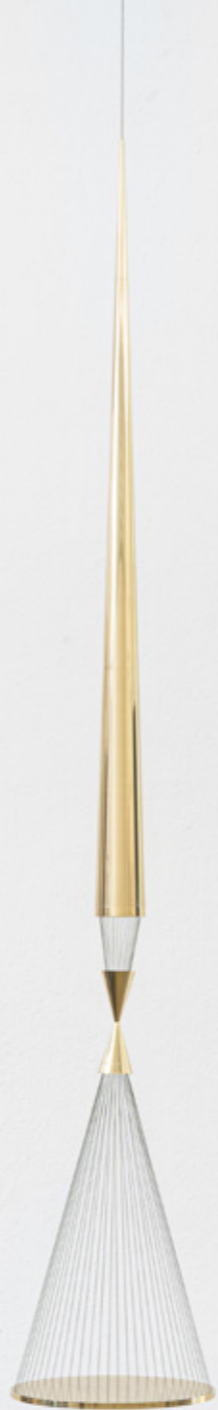
Mintaka , 2019 latão e linhas de multifilamento brass and multifilament lines edição de 5 + 2 PA/edition of 5 + 2 AP 240 x Ø 40 cm/94.5 x Ø 15.7 in