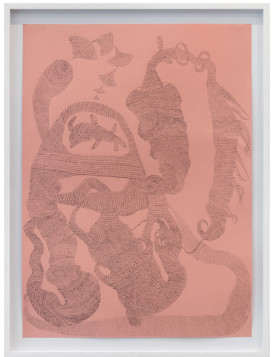
Instante I, 2018 lápiz grafite sobre papel colorido 47,5 x 65 cm