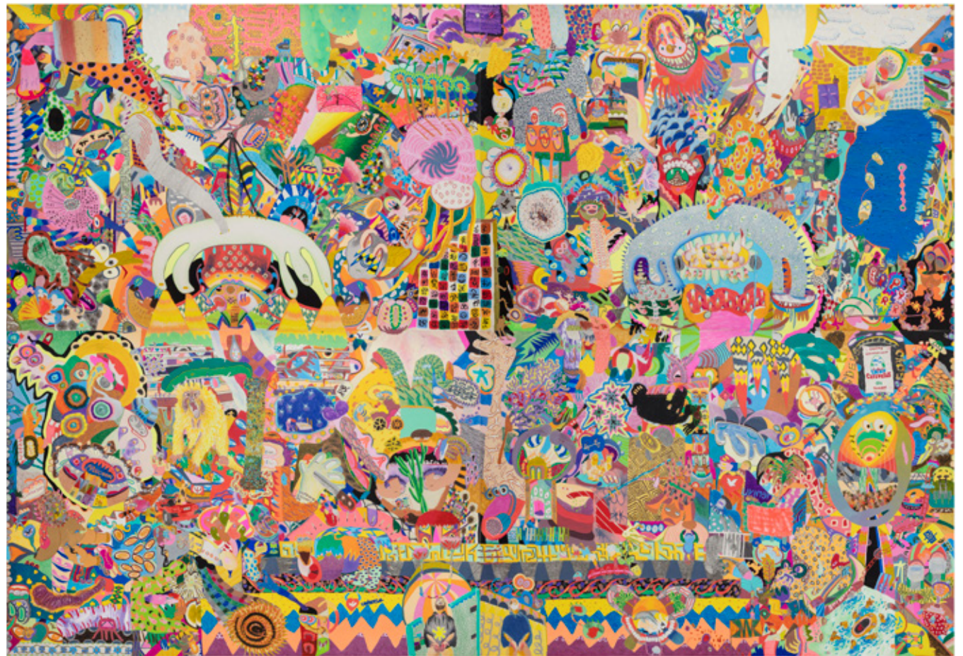
Dois louva-a-deus , 2019-2020 lápis de cor, grafite, caneta esferográfica, marcador permanente, óleo, pastel, acrílica, e spray sobre papel 234 x 160 cm