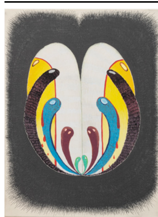
Meu guia , 2022 lápiz de cor, grafite, caneta esferográfica e marcador permanente sobre tela 40 x 30 cm