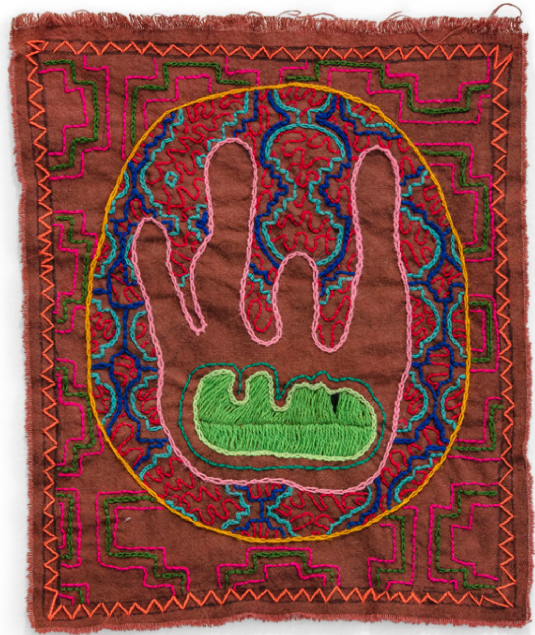
Prenúncio em Ucayali , 2020 bordado em tecido com pigmento natural e algodão 22 x 19 cm