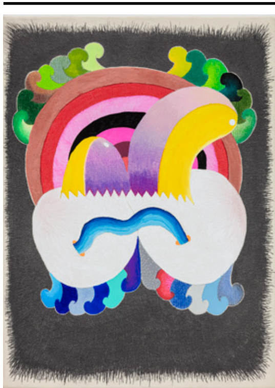
O ninho não foi visto: nasceu , 2021 lápiz de cor, grafite, caneta esferográfica e marcador permanente sobre tela 40 x 30 x 2 cm