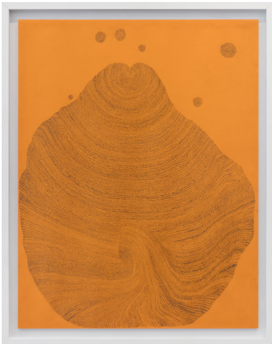
Instante XII, 2018 lápiz grafite sobre papel colorido 47,5 x 65 cm