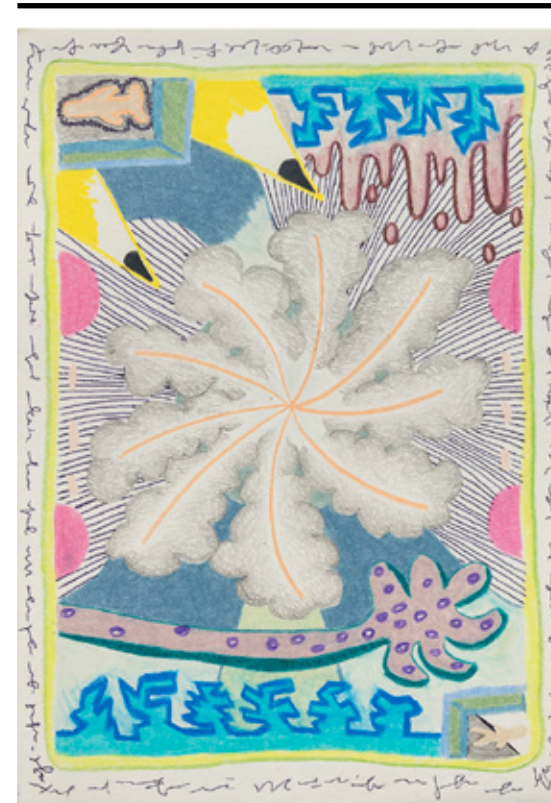
Atrás do que vi (Yarinacocha, Amazônia peruana), 2019 lápiz de cor, grafite, caneta esferográfica e marcador permanente sobre papel 21 x 14 cm