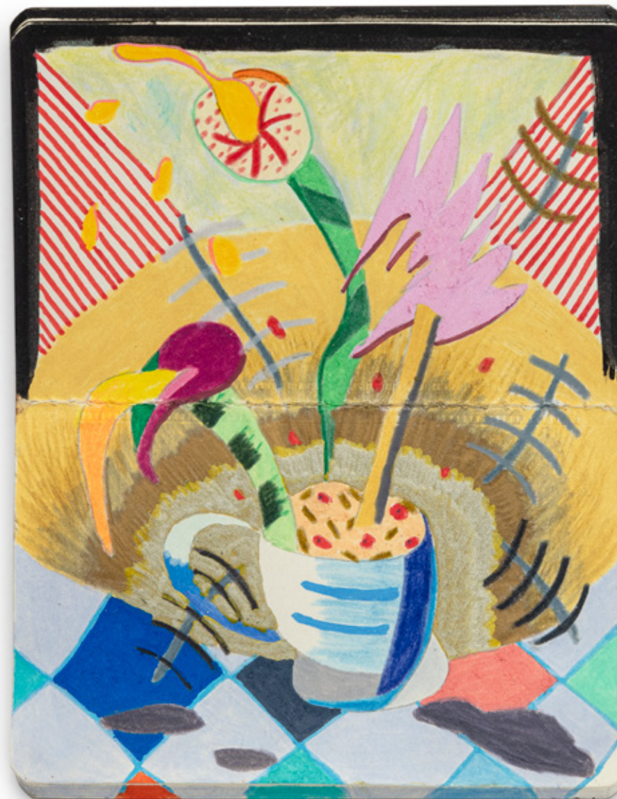
Caderninho VI , 2021 lápis de cor, grafite, caneta esferográfica, marcador permanente, giz de cera e spray sobre papel 15 x 20 cm

Os desenhos de Thiago Barbalho acontecem, também, na intimidade dos cadernos. Essa prática, comum a muitos artistas, permite o livre exercício da mão e a experimentação desinteressada. Por vezes, um desenho pode se formar de modo mais incisivo, mais afinado em suas qualidades formais e materiais. Paranoia (2019) é exemplar nesse sentido. Barbalho selecionou aquele desenho que lhe parecia digno de ser compartilhado com o público e o emoldurou, sem destacá-lo da encadernação. Desse modo, o artista respeita o próprio processo e suporte do trabalho, deixando os outros desenhos adormecidos debaixo daquele que observamos.