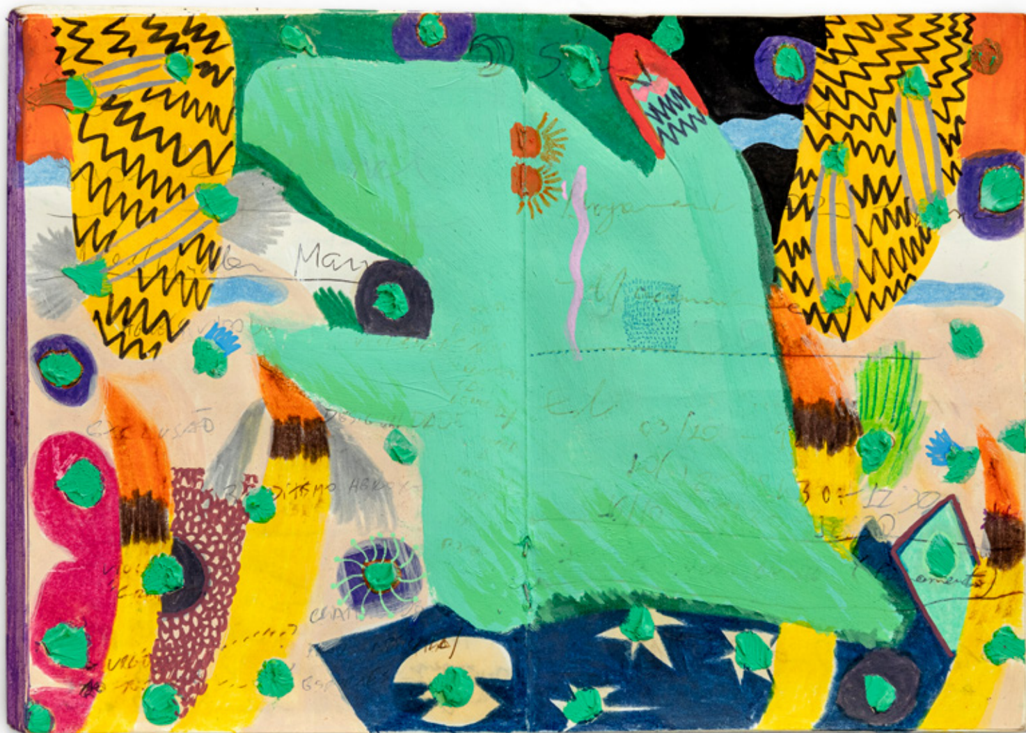
Caderninho V (Paranoia), 2020 lápis de cor, grafite, caneta esferográfica, marcador permanente, giz de cera e spray sobre papel 15 x 20 cm