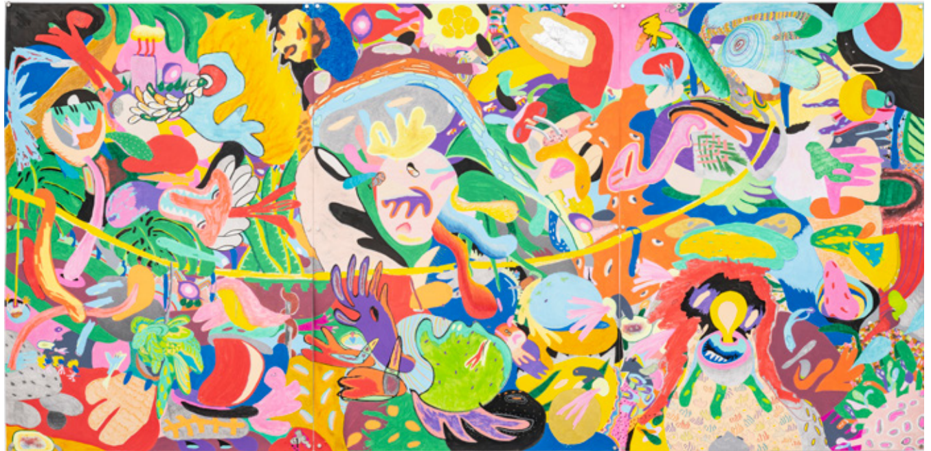
Triptico I , 2018 tinta acrílica, giz de cera, lápiz de cor, grafite, caneta esferográfica, marcador permanente, pastel oleoso e tinta spray sobre papel 240 x 120 cm

O eixo ancora o observador em suas andanças pelos labirintos de figuras de Barbalho, e lhes confere atributos, como a simetria, que subjaz à eloquência de suas imagens e traz aos desenhos um caráter vertiginoso que parece se comunicar com o excesso de imagens da vida contemporânea, apresentadas pelas múltiplas telas que nos rodeiam, ao mesmo tempo em que aponta para outras relações entre as imagens e as coisas que elas representam.