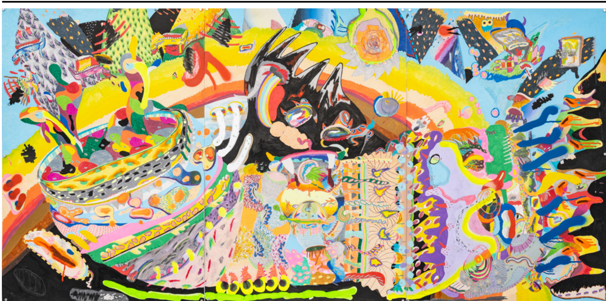
Triptico II , 2018 tinta acrílica, giz de cera, lápiz de cor, grafite, caneta esferográfica, marcador permanente, pastel oleoso e tinta spray sobre papel 225 x 120 cm