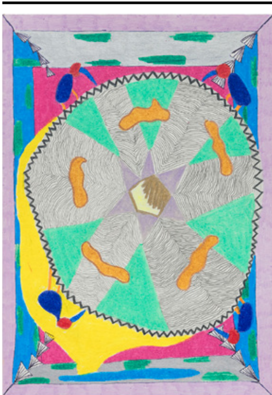
Atrás do que vi (Yarinacocha, Amazônia peruana), 2019 lápiz de cor, grafite, caneta esferográfica e marcador permanente sobre papel 21 x 14 cm