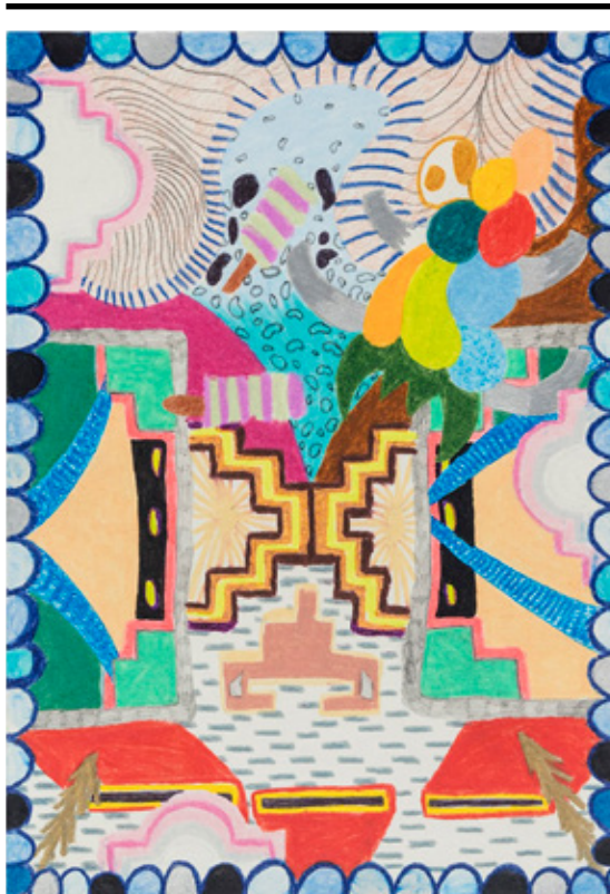
Atrás do que vi (Yarinacocha, Amazônia peruana), 2019 lápiz de cor, grafite, caneta esferográfica e marcador permanente sobre papel 21 x 14 cm