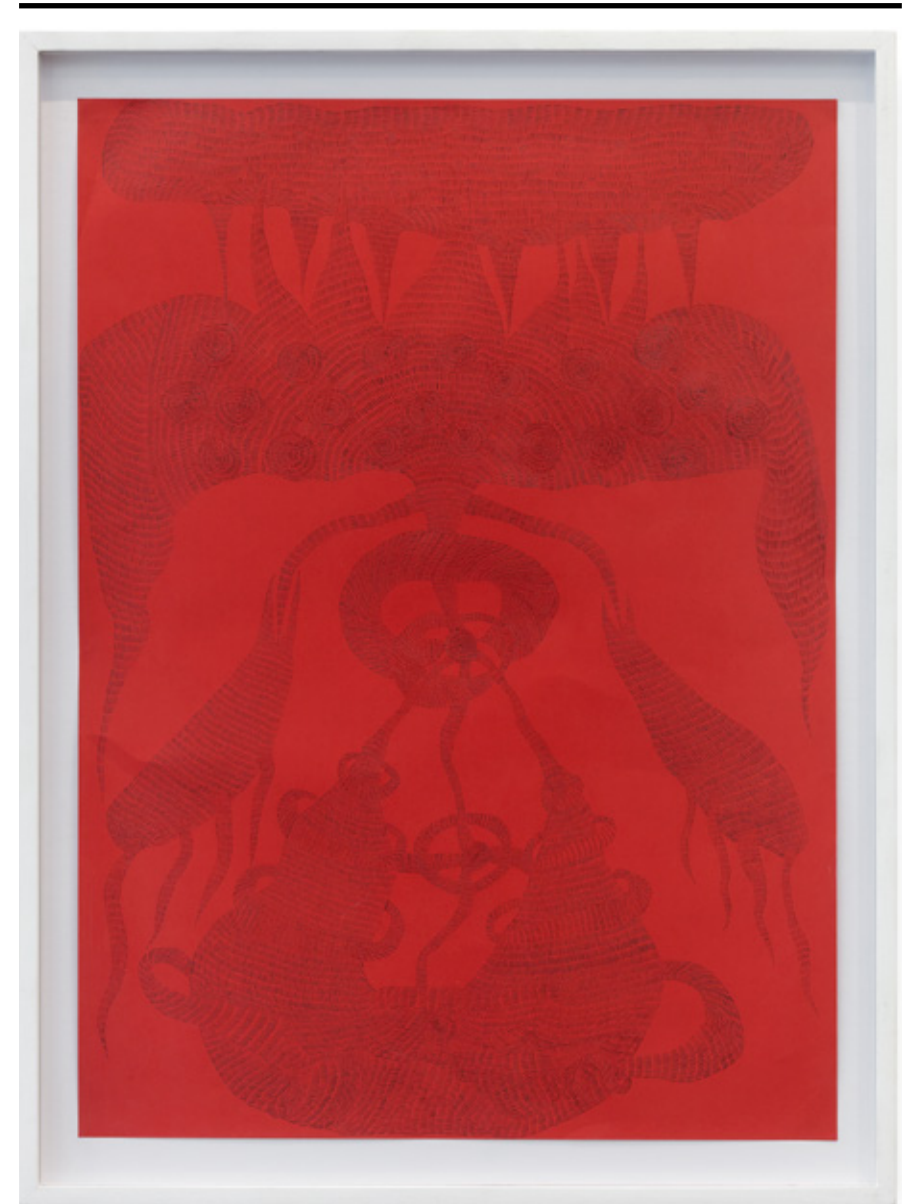
Instante IV, 2018 lápiz grafite sobre papel colorido 47,5 x 65 cm

Aos poucos, esses conjuntos de traços, cujos intervalos, espessura e tamanho criam diferentes ritmos visuais, são capazes de conferir uma riqueza de texturas que quebra com a suposta monotonia do processo. As formas orgânicas, arredondadas, também são um contraponto à racionalidade do processo, não sendo programadas pelo artista, mas acontecem durante a feitura do desenho, a partir de pequenas decisões que Barbalho vai tomando a cada novo passo.