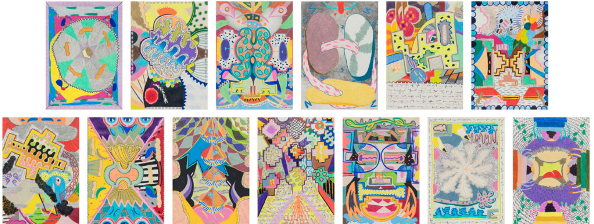
Atrás do que vi (Yarinacocha, Amazônia peruana), 2019 lápiz de cor, grafite, caneta esferográfica e marcador permanente sobre papel 16 partes de 21 x 14 cm