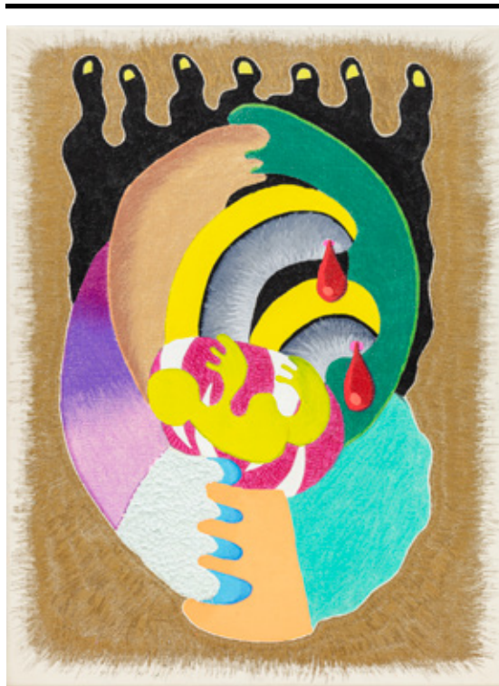
Mãinha muito voraz , 2022 lápiz de cor, grafite, caneta esferográfica e marcador permanente sobre tela 40 x 30 x 2 cm