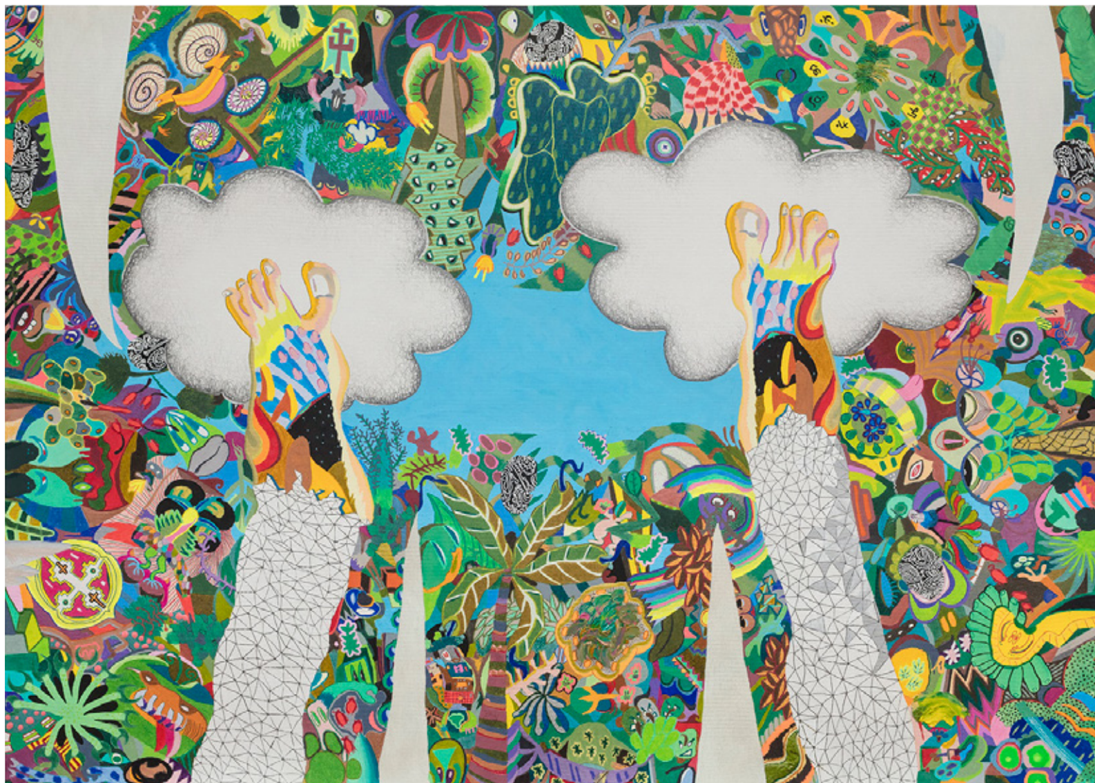
De pernas pro ar (sendo engolido) , 2020 grafite, lápis de cor, caneta esferográfica, marcador permanente, acrílica e óleo sobre papel 72 x 101 cm