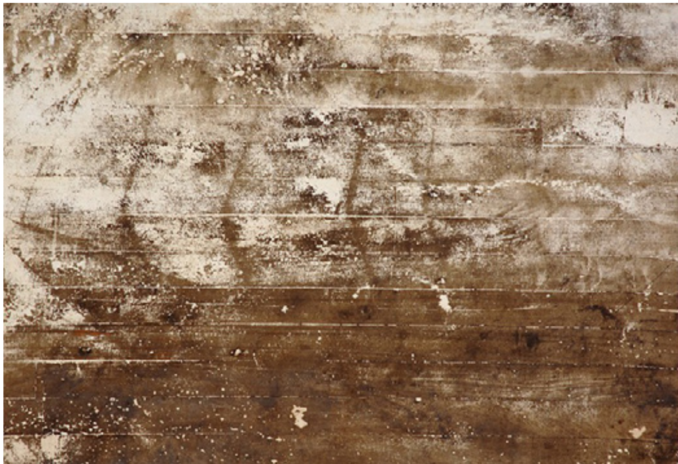
Chuva 2005 medium acrílico e resíduos sobre tecido em colagem sobre madeira/acrylic medium and residues on canvas glued onto wood 130 x 200 cm