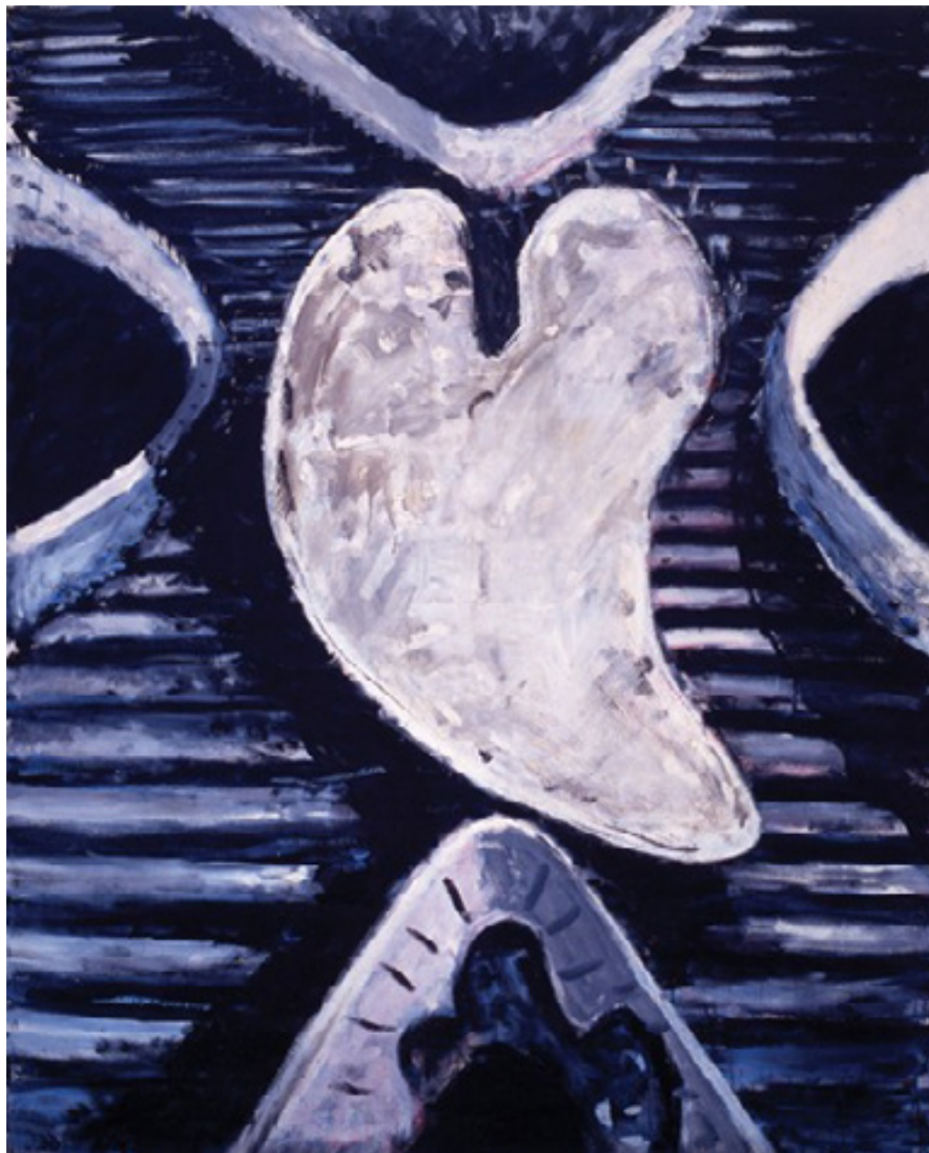
sem título 1985 acrílica sobre tela/acrylic on canvas 230 x 190 cm