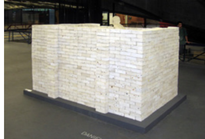
Eva 2009 -- vista da exposição/exhibition view -- Centro Cultural São Paulo