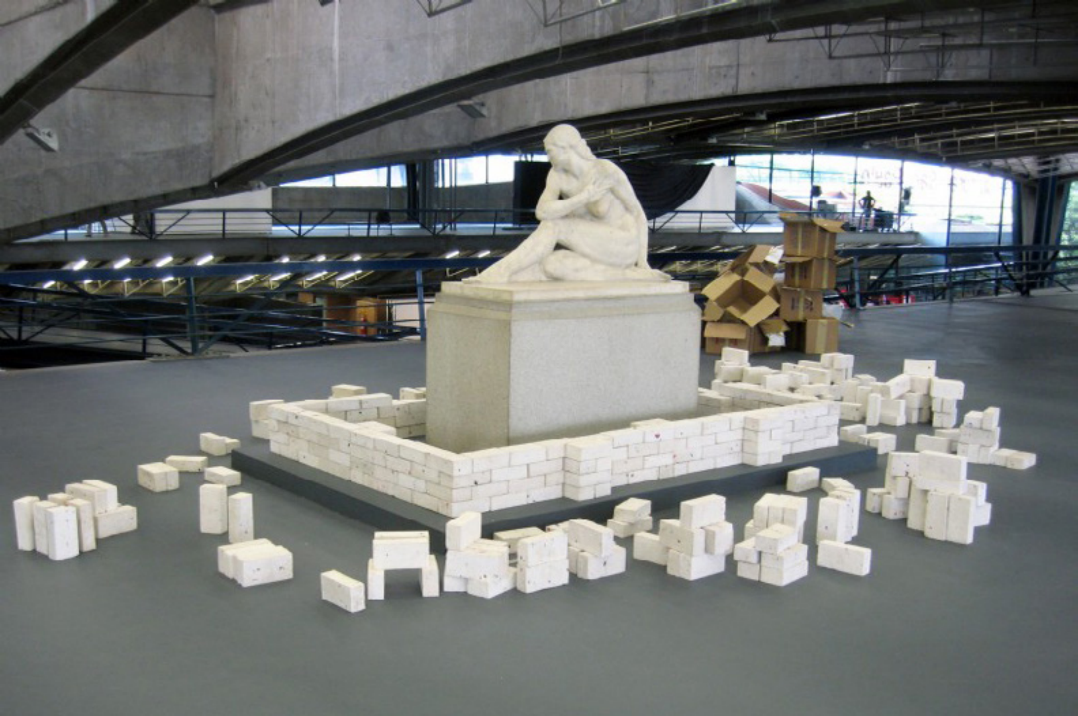
Eva 2009 -- vista da exposição/exhibition view -- Centro Cultural São Paulo