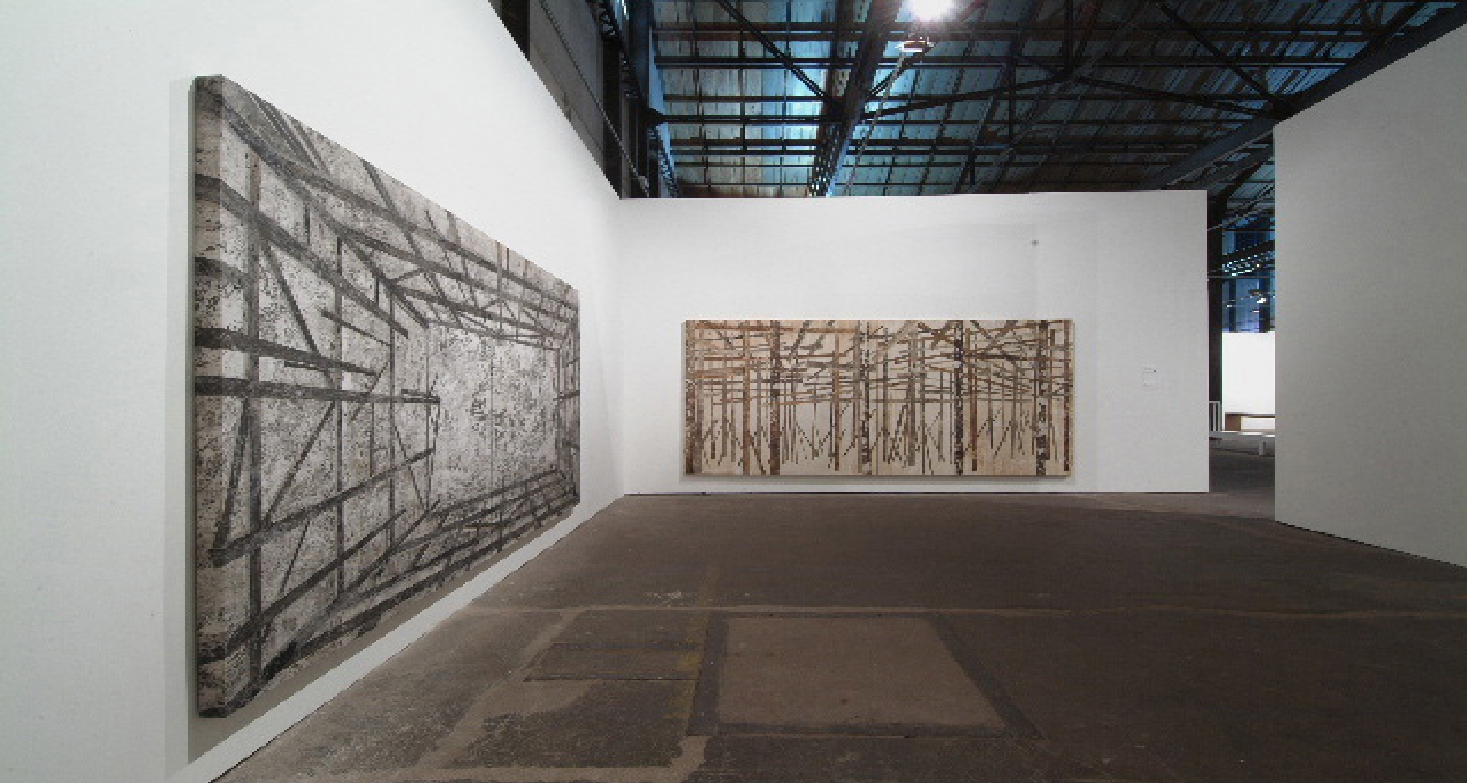
vista da exposição/exhibition view -- V Bienal do Mercosul, Porto Alegre, 2006