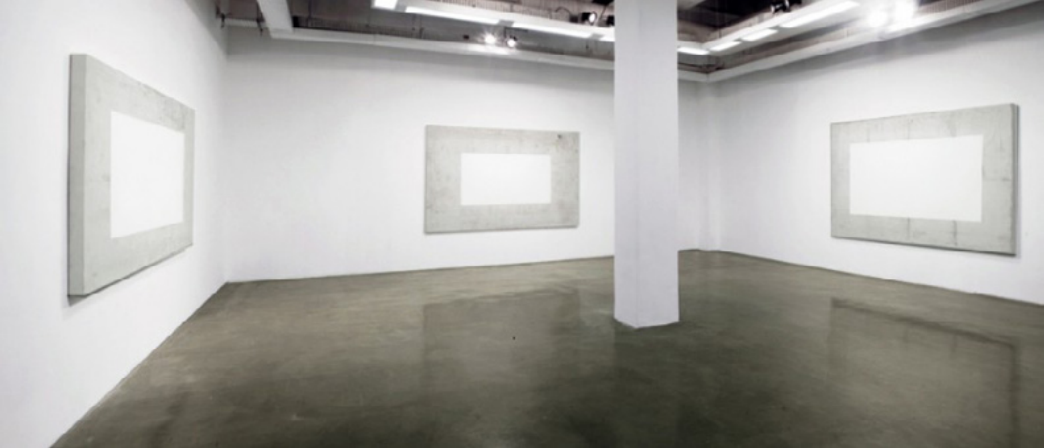
Quase aqui 2015 -- vista da exposição/exhibition view -- Oi Futuro, Rio de Janeiro, Brazil