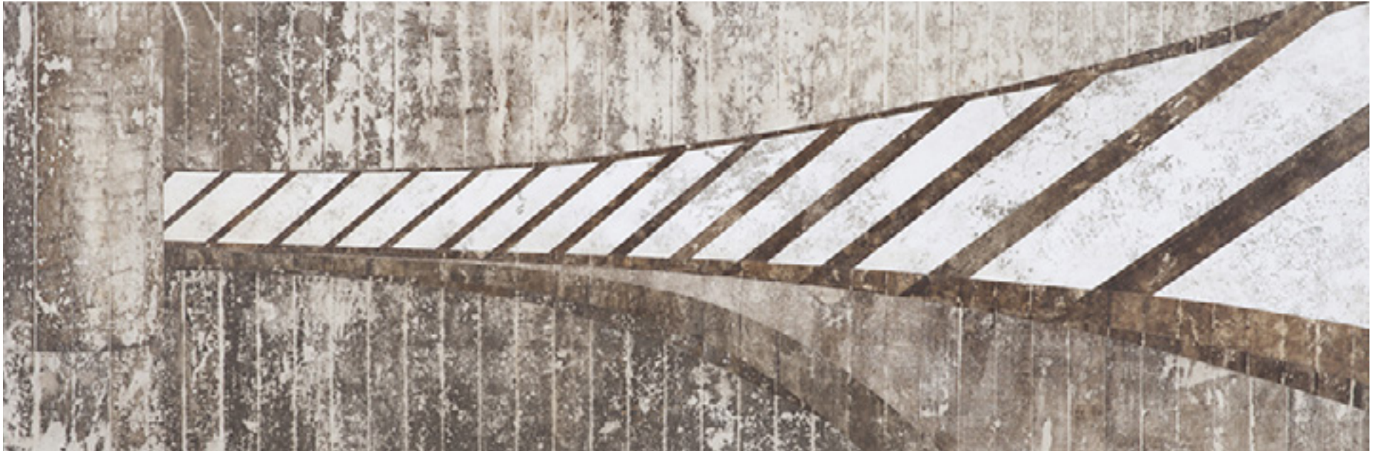
Mac (Museu de Arte Contemporanea de Niteroi) 2014 medium acrílico e residuos sobre tecido sobre aluminio/acrylic media and residues on canvas on aluminum -- 125 x 375 cm