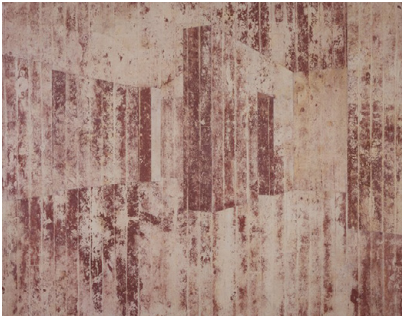
Haus Lange, Krefeld 2001 medium acrílico e resíduos sobre tecido em colagem sobre madeira/acrylic medium and residues on canvas glued onto wood 152 x 190 cm