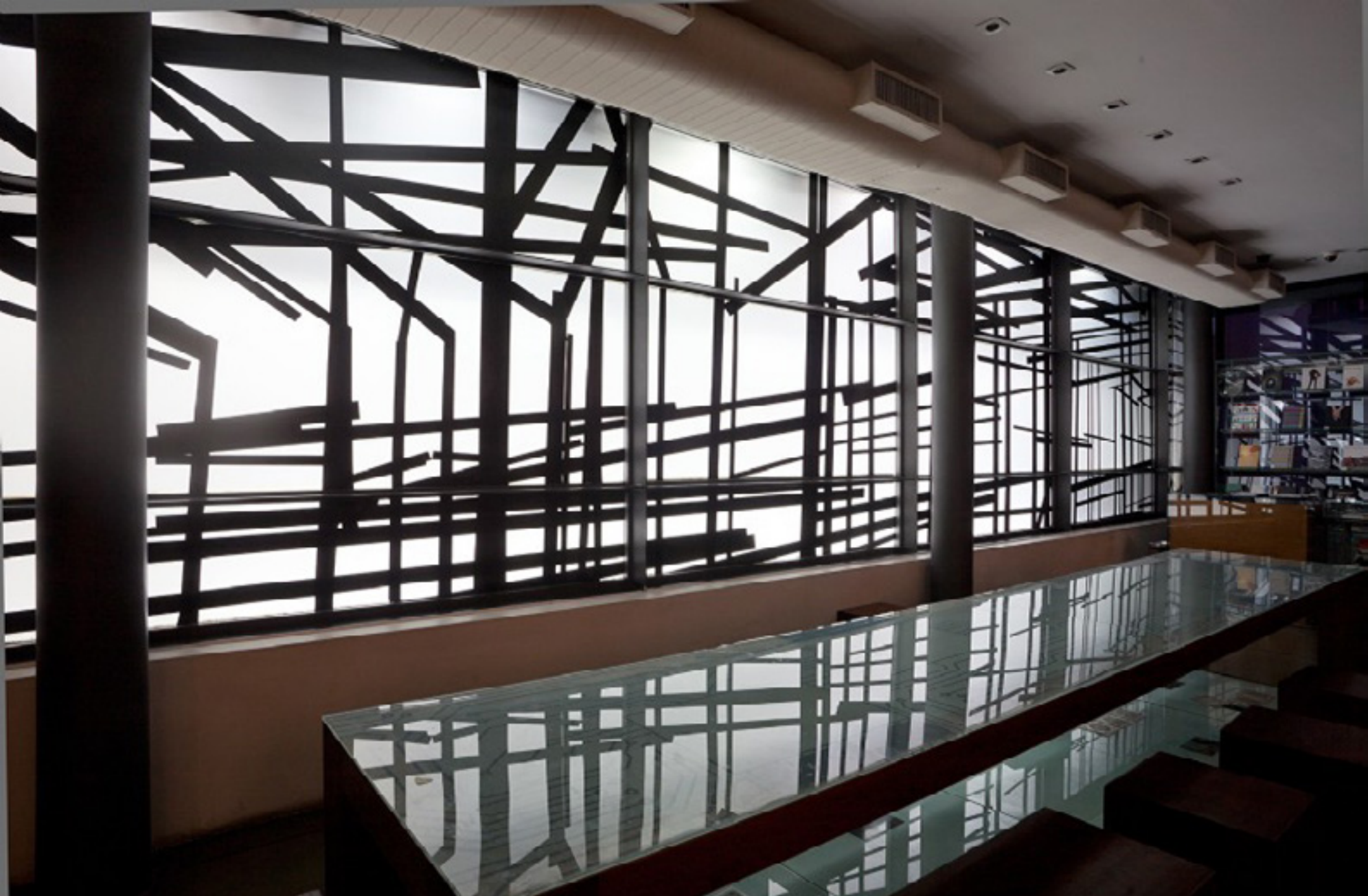
Quase aqui 2015 -- vista da exposição/exhibition view -- Oi Futuro, Rio de Janeiro, Brazil