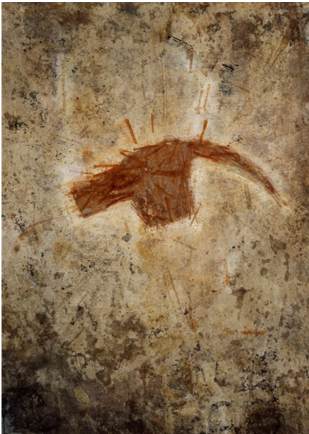
sem título 1992 acrílica e óxido de ferro sobre cretone/acrylic and iron oxide on cretonne 144 x 106 cm