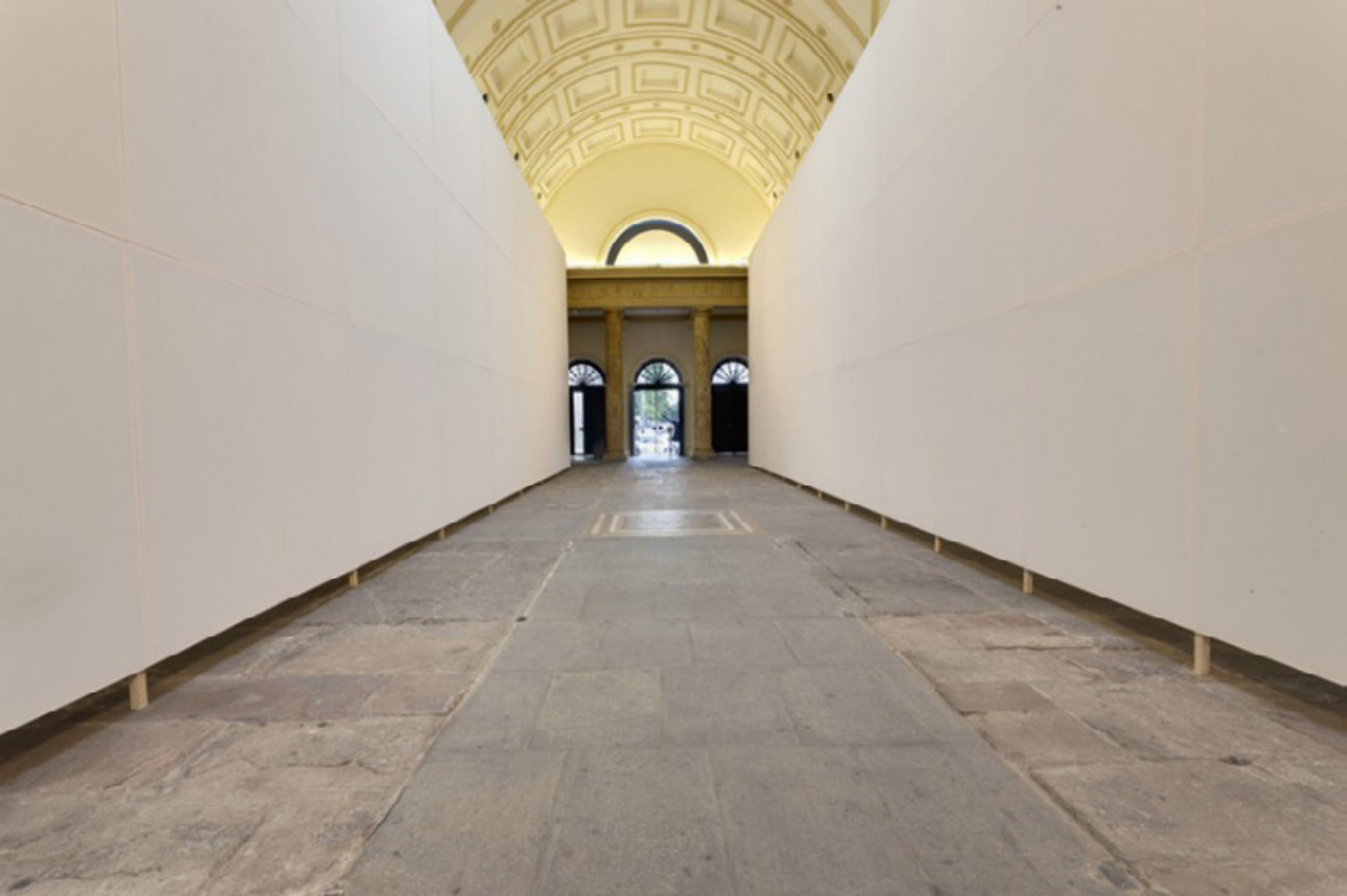
2892 1993-2011 -- vista da exposição/exhibition view -- Casa França Brasil -- Rio de Janeiro -- Brazil - 2011