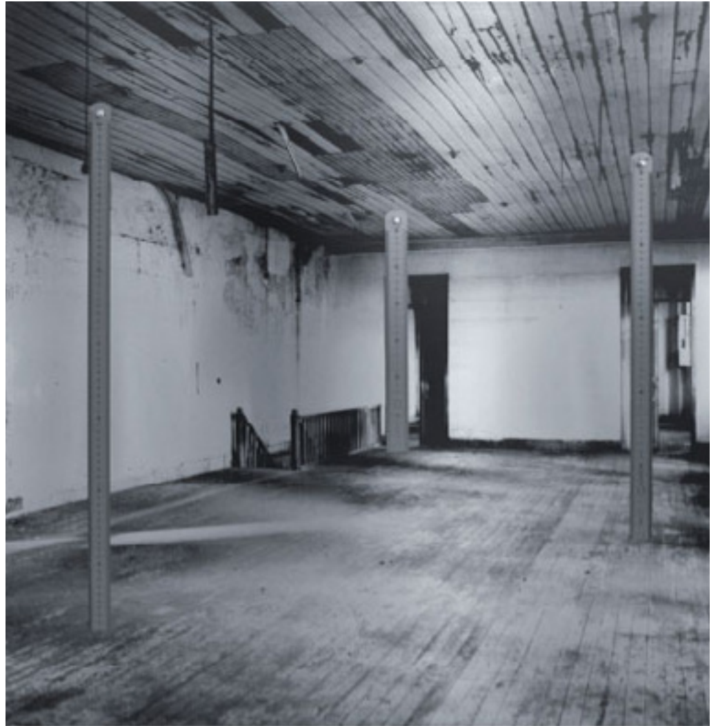
Sem título/Untitled 2013 serigrafia e aplicação de reguas de aço sobre alumínio/screen printing and steel rulers on aluminum -- 100 x 100 cm