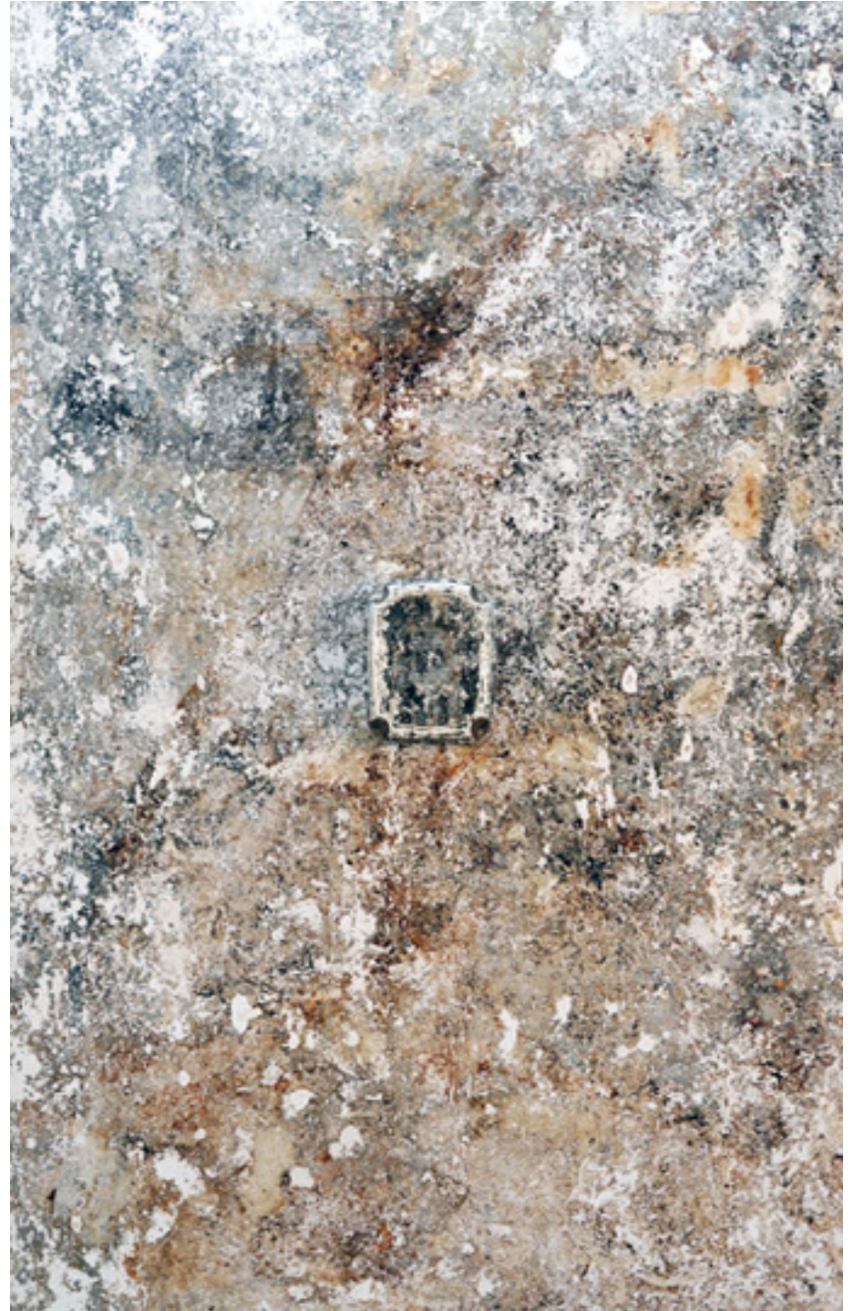
Legenda 2008 cretone com impressão de cimento e objeto de plástico sobre madeira/cretonne with cement printing and plastic object on wood 311 x 201 cm