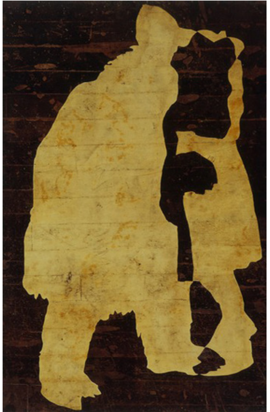
sem título 2000 medium acrílico e resíduos sobre tecido em colagem sobre madeira/acrylic medium and residues on canvas glued onto wood 101 x 66 cm