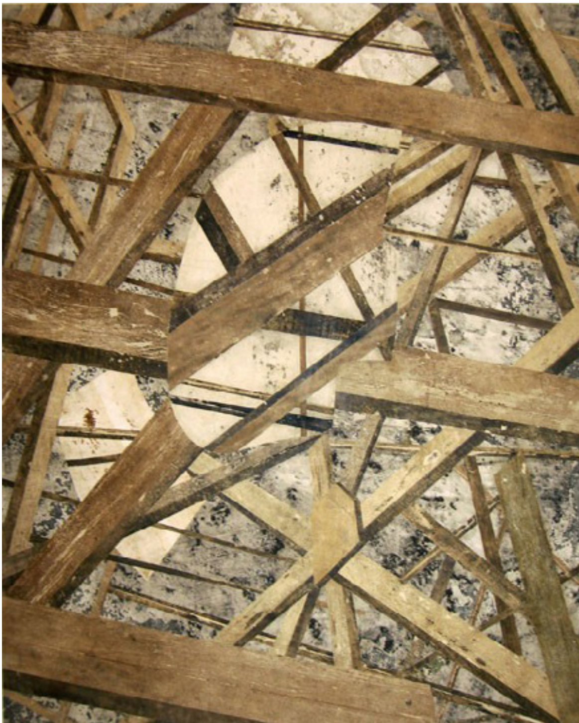
Prodrome II 2010 medium acrílico e resíduos sobre tecido em colagem sobre alumínio/acrylic medium and residues on canvas glued onto aluminum 150 x 125 cm