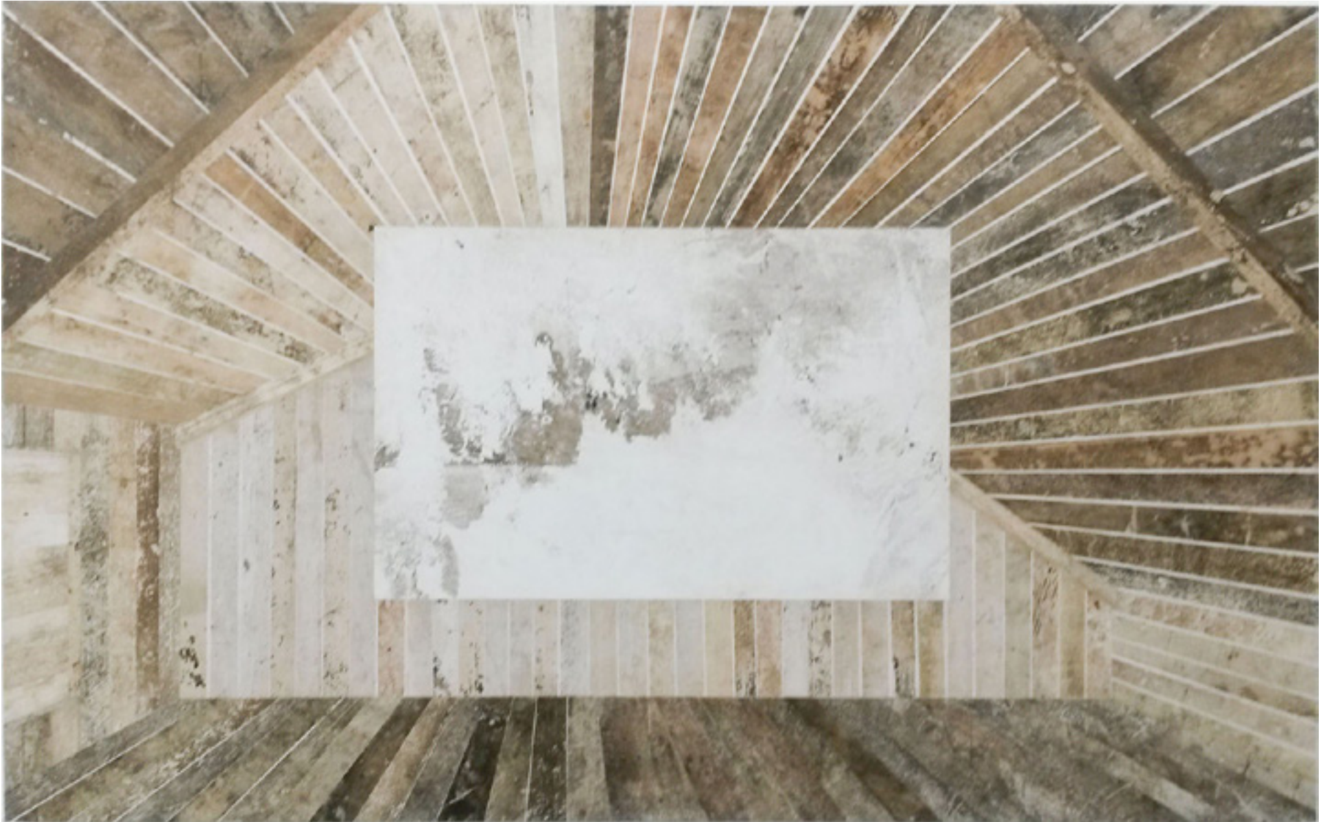
Biógrafo XX 2014 medium acrílico e resíduos sobre tecido em colagem sobre alumínio/acrylic medium and residues on canvas glued onto aluminum -- 125 x 200 cm