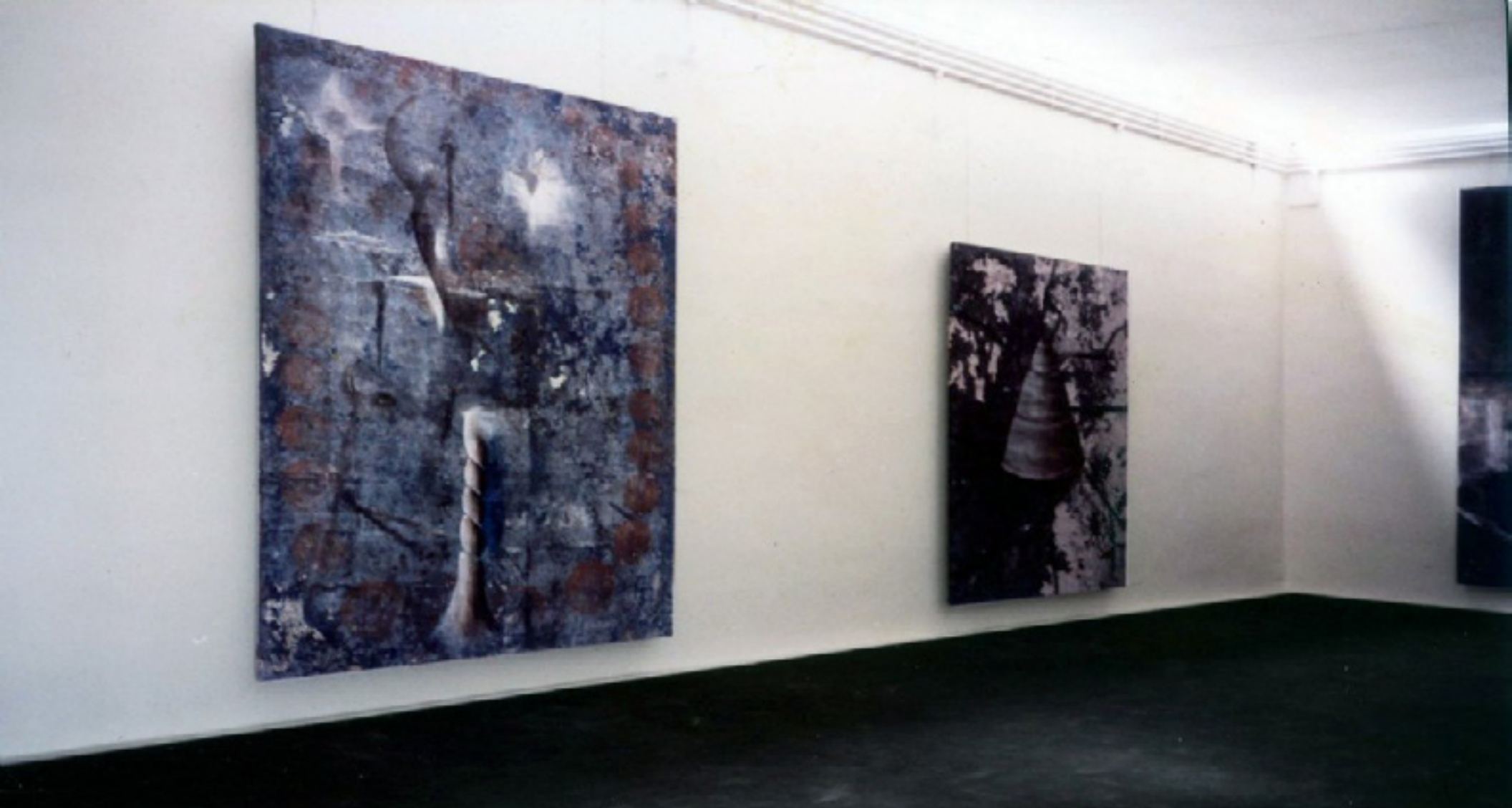
vista da exposição/exhibition view -- 44ª Biennale di Venezia, Venice, Italy, 1990