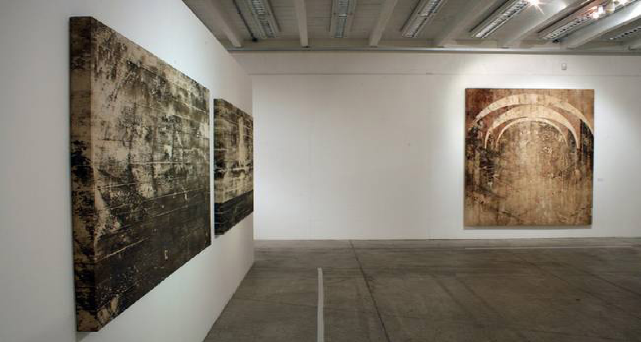
2000-2006 2006 -- vista da exposição/exhibition view -- Museu Oscar Niemeyer, Curitiba