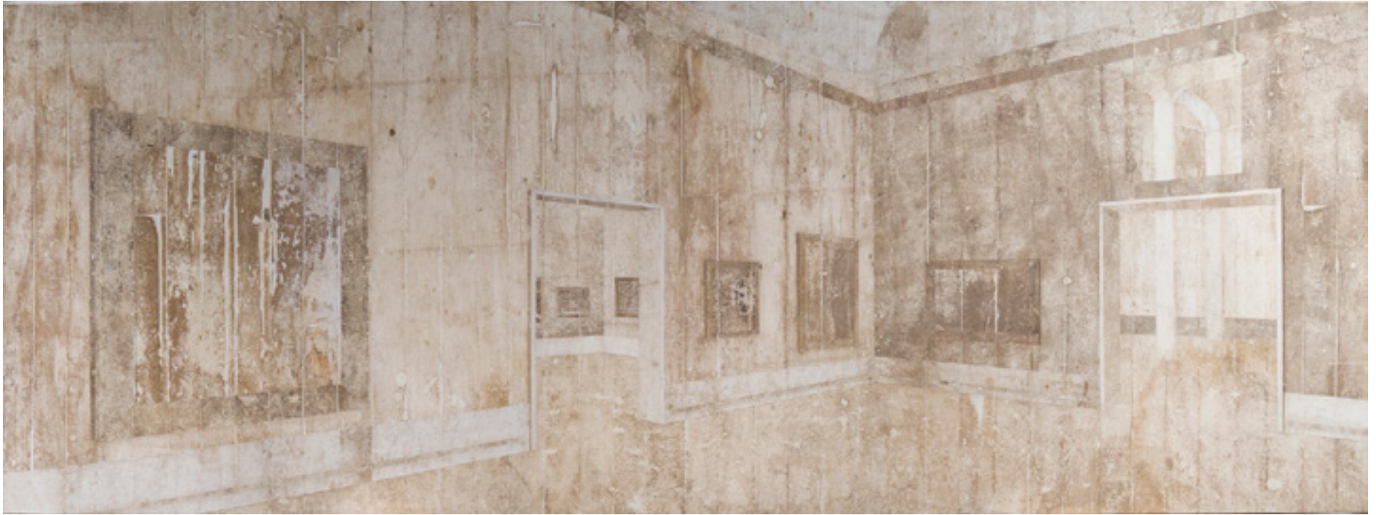
Gemäldegalerie Berlin 2014 medium acrílico e resíduos sobre tecido em colagem sobre alumínio/acrylic medium and residues on canvas glued onto aluminum -- 150 x 400 cm