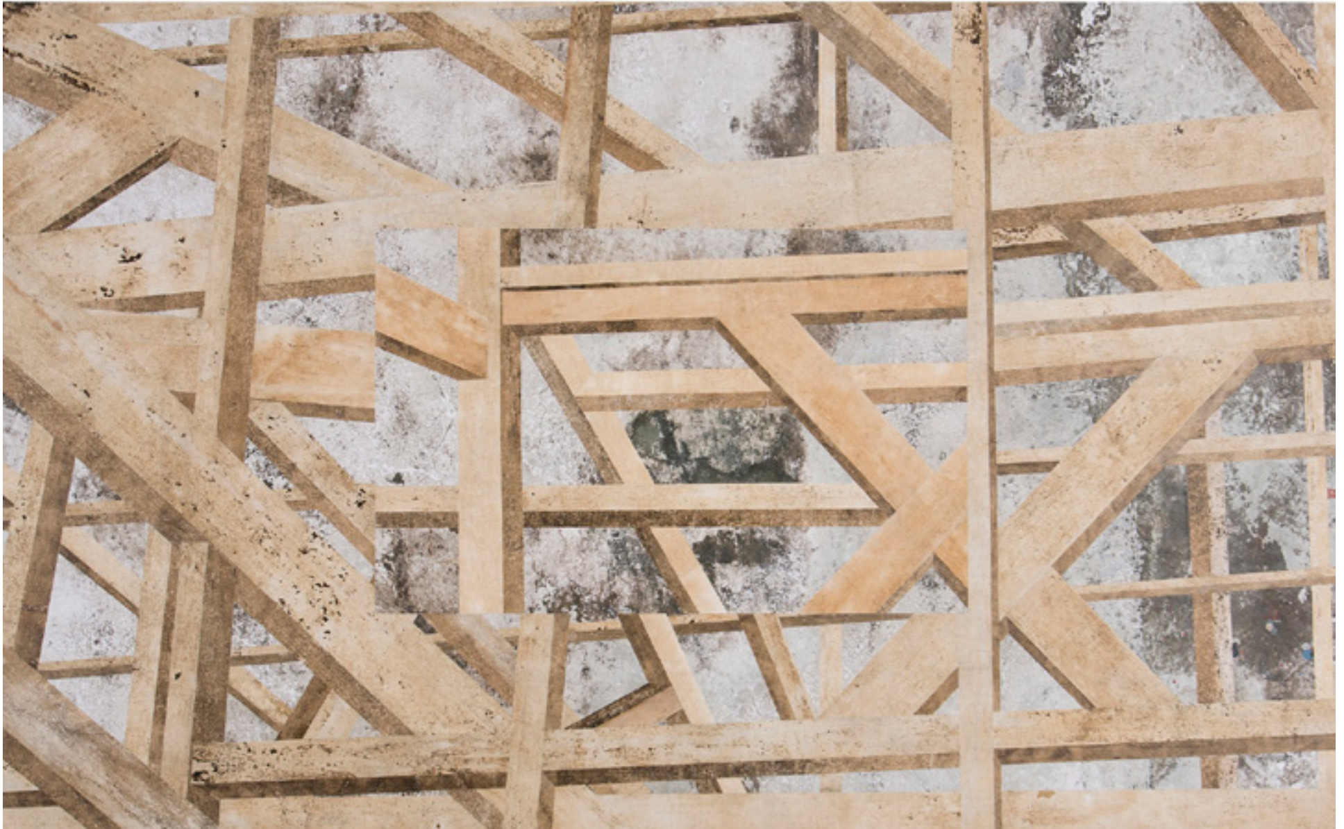
Biógrafo (XV) 2013 medium acrílico e resíduos sobre tecido em colagem sobre alumínio/acrylic medium and residues on canvas glued onto aluminum -- 125 x 200 cm