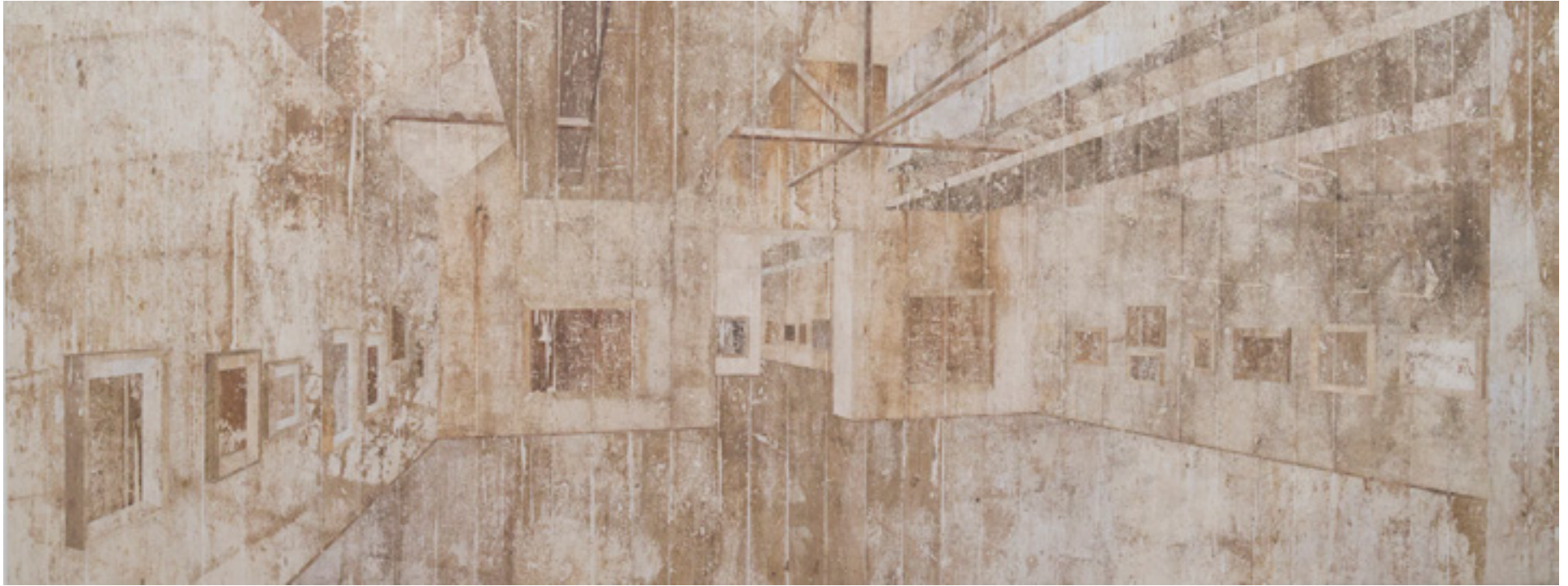
Musée D'Orsay 2014 medium acrílico e resíduos sobre tecido em colagem sobre alumínio/acrylic medium and residues on canvas glued onto aluminum -- 150 x 400 cm