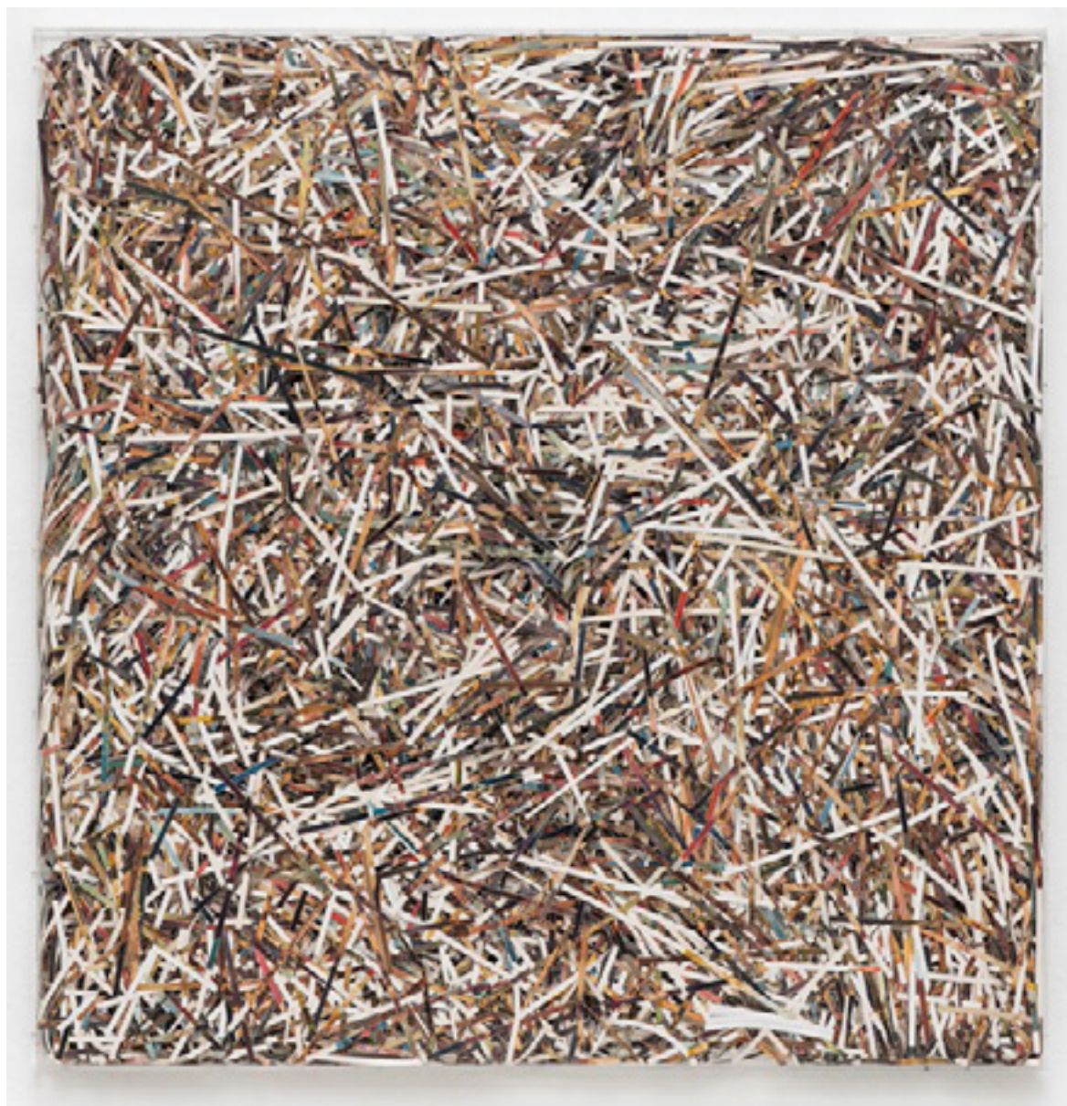
Museu (Museo del Prado) 2013 reproduções de obras do Museo del Prado fragmentadas em caixa de acrílico/ fragmented reproductions of works from the Museo del Prado in acrylic box -- 125 x 125 cm