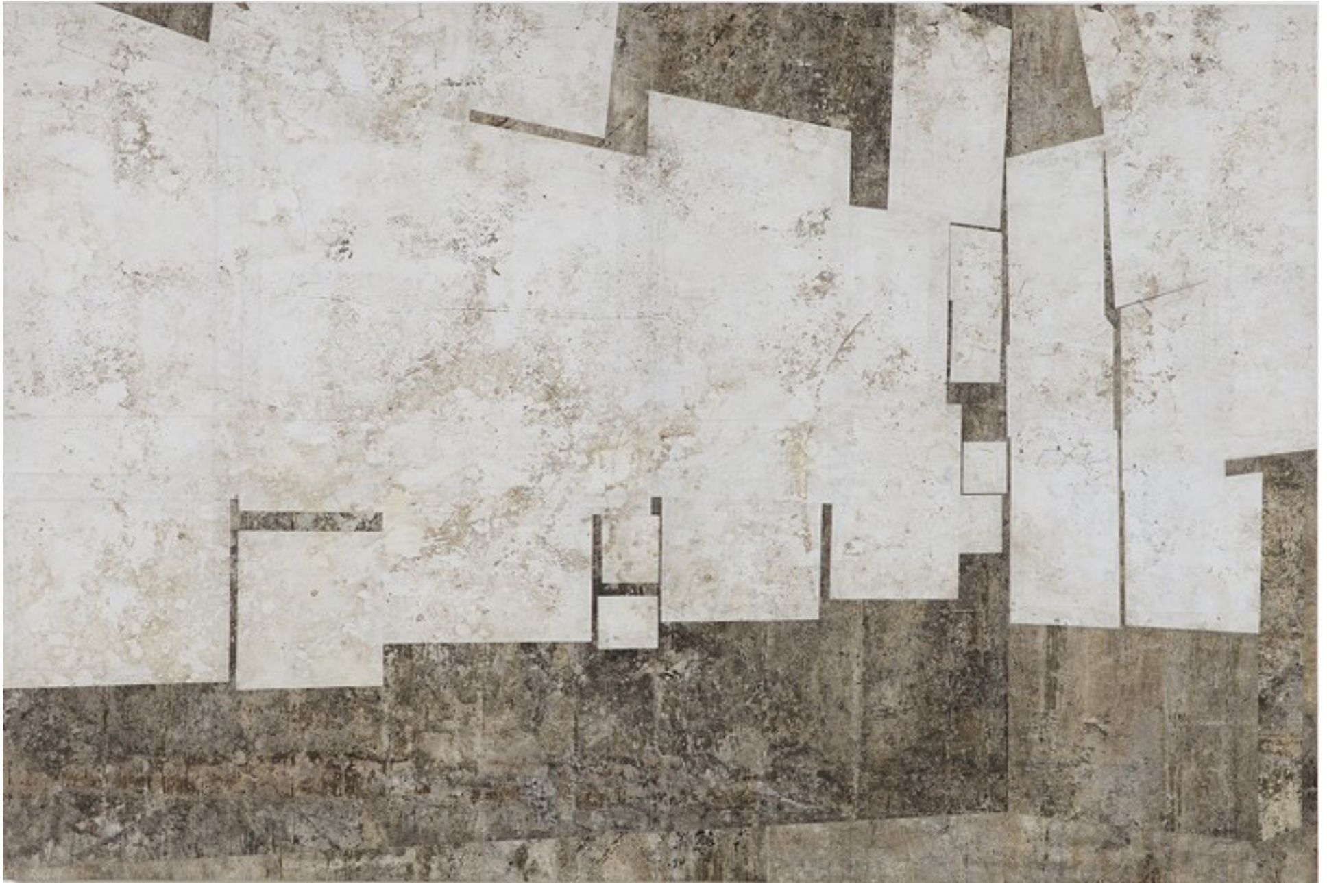
Le Salon 2015 medium acrilico e residuos sobre tecido/acrylic medium and residues on canvas glued onto aluminum -- 200 x 300 cm