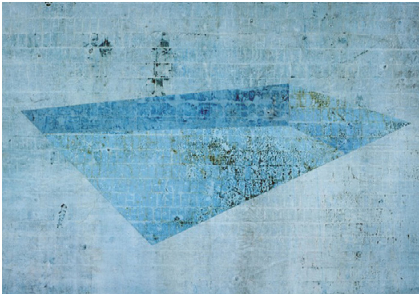
Piscina 2 2003 medium acrílico e resíduos sobre tecido em colagem sobre madeira/acrylic medium and residues on canvas glued onto wood 185 x 290 cm