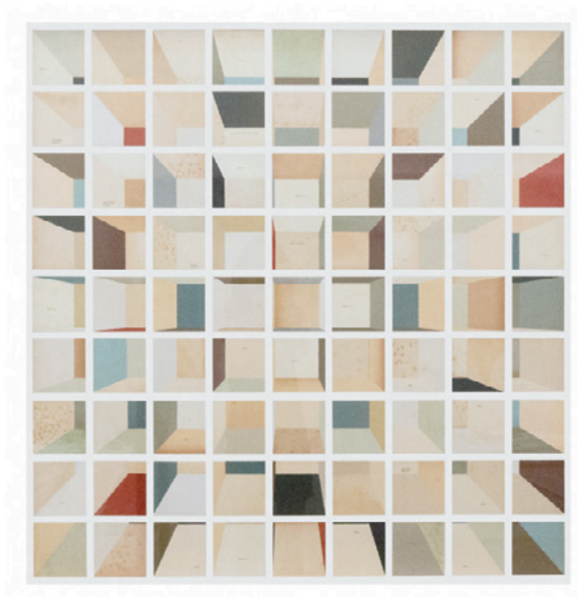
Remb.55 2014 papel de livros de arte sobre alumínio com moldura/ pages of art books in collage on aluminum - with framework -- 107 x 107 cm