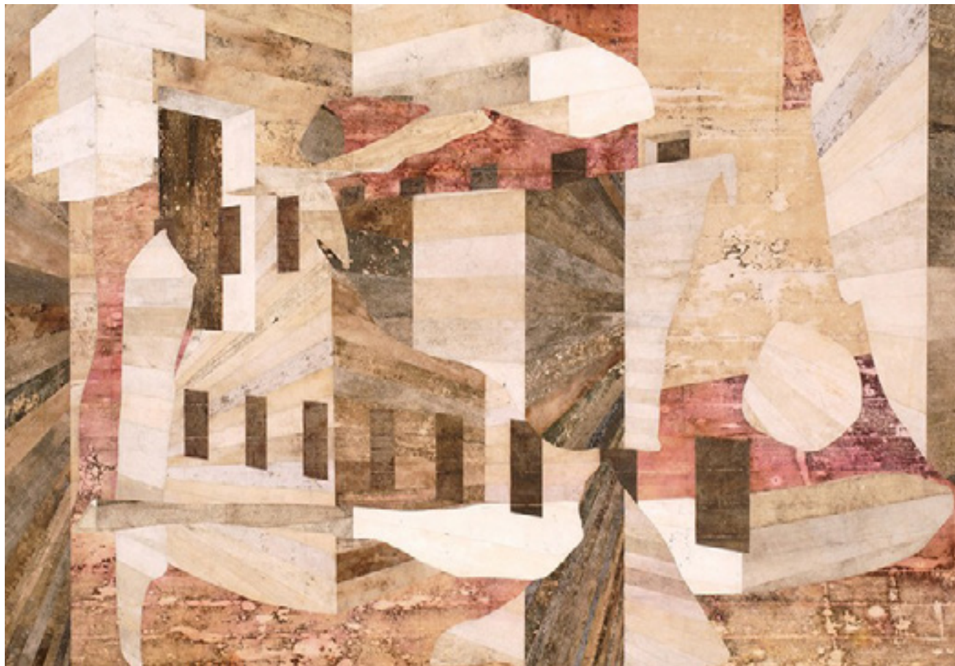
Reino I 2006 medium acrílico e resíduos sobre tecido em colagem sobre alumínio/ acrylic medium and residues on canvas glued onto wood 200 x 300 cm