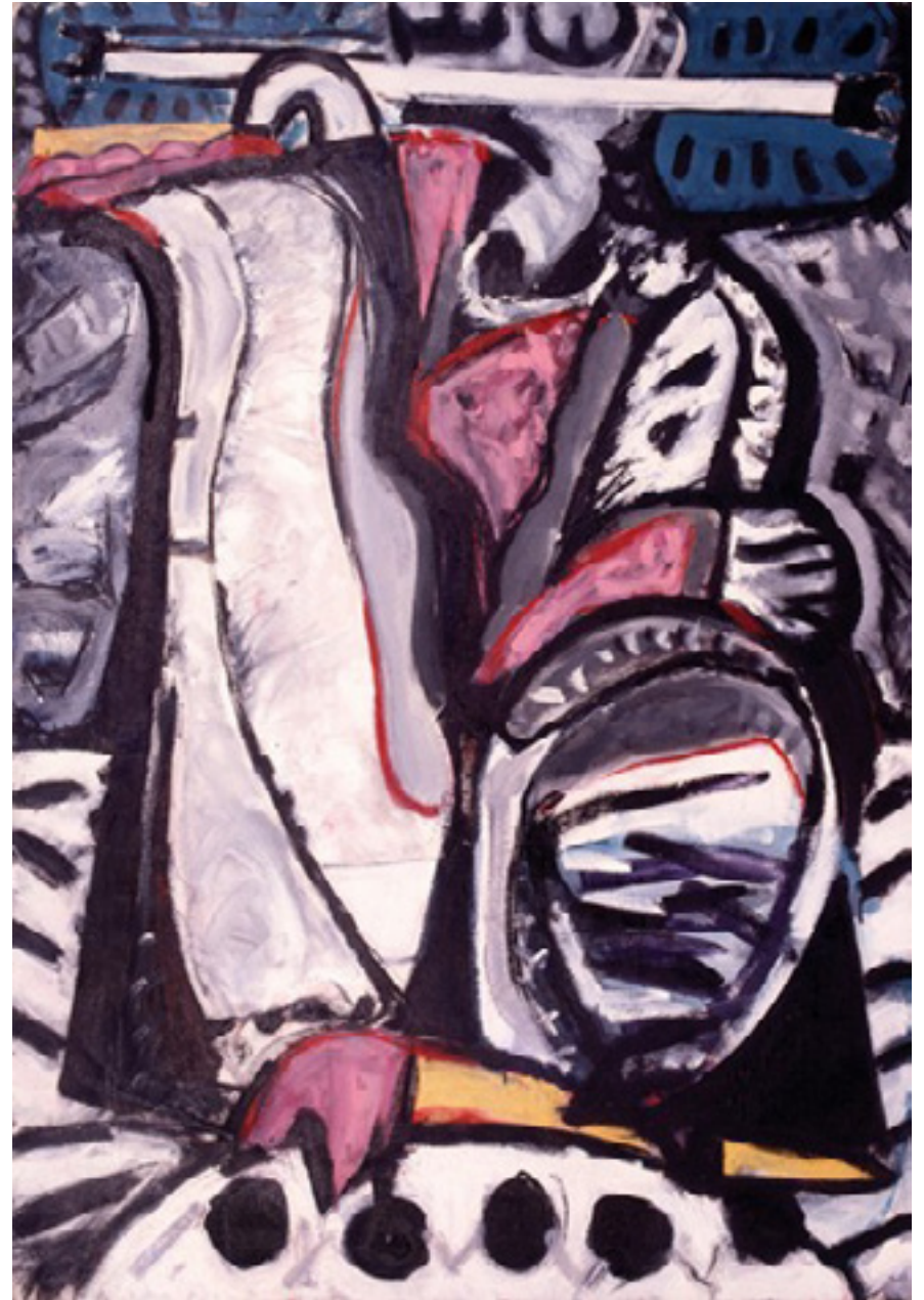
A solidão de my friend 1984 acrílica sobre tela/acrylic on canvas 191 x 135 cm