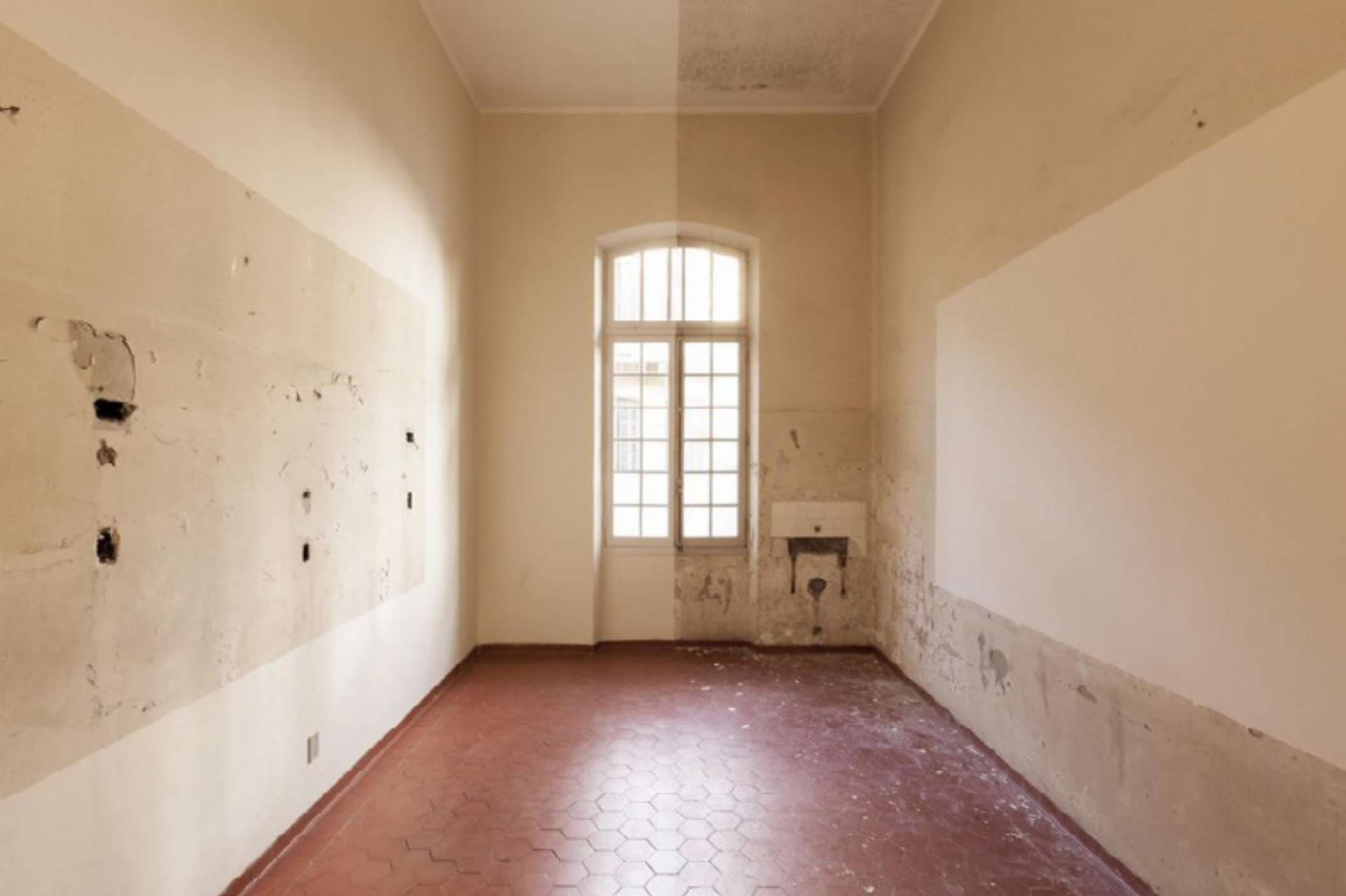
Made by...Feito por brasileiros 2014 -- vista da exposição/exhibition view -- Antigo Hospital Matarazzo, São Paulo, Brazil