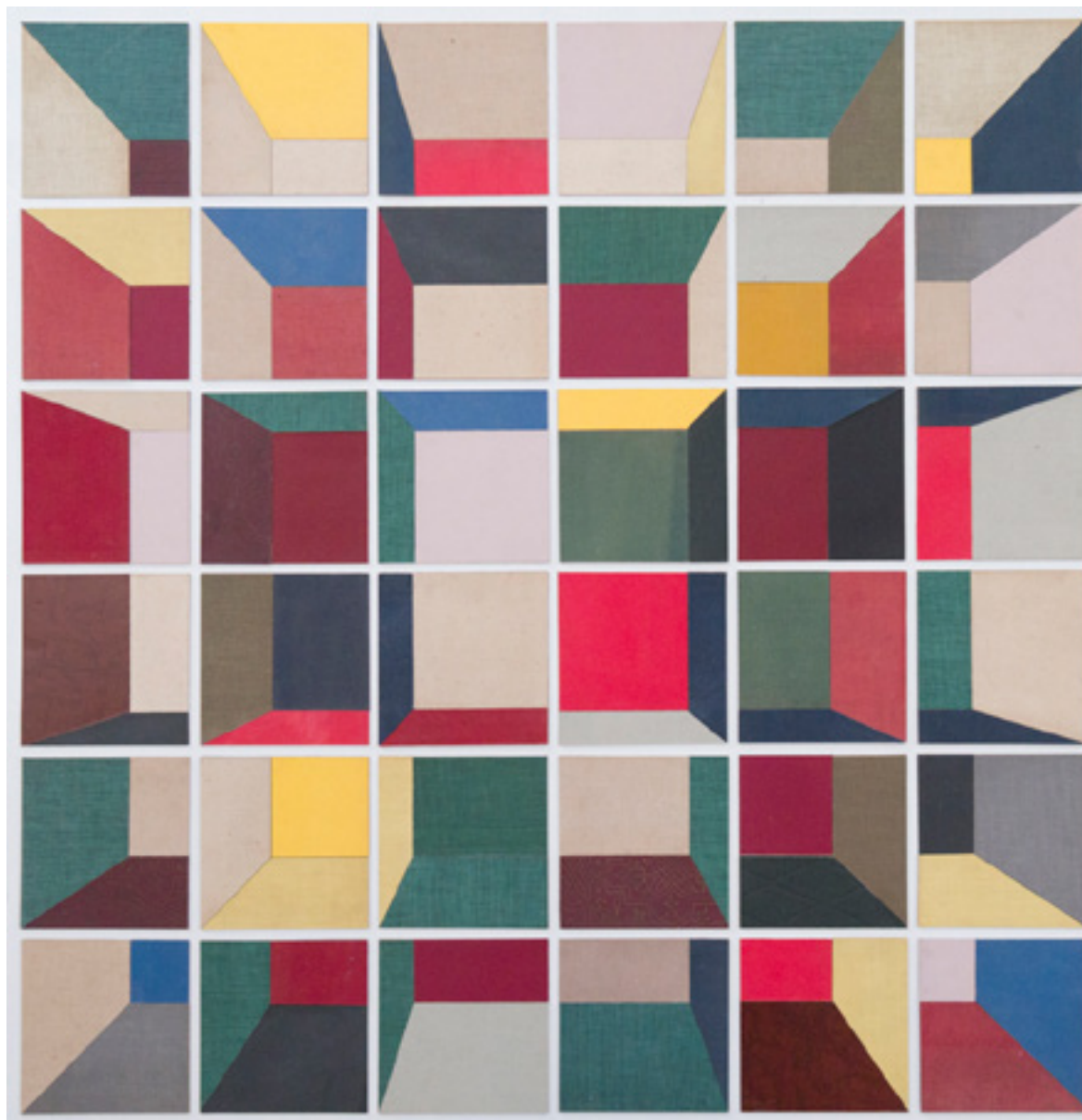
Exs 2014 capas de livros de arte coladas sobre alumínio/ art book covers glued onto aluminum -- 125 x 125 cm