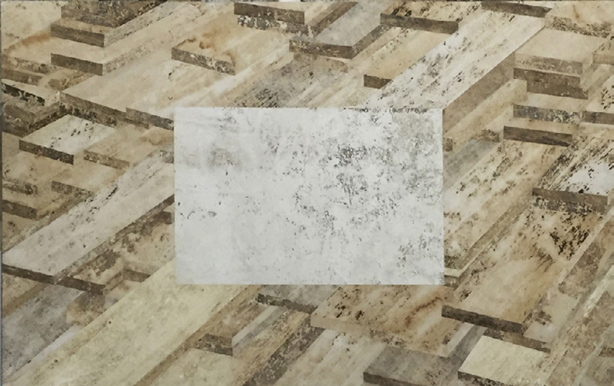
Biografo LXXXI 2016 medium acrílico e resíduos sobre tecido sobre alumínio/acrylic medium and cloth residue on aluminum -- 125 x 200 cm