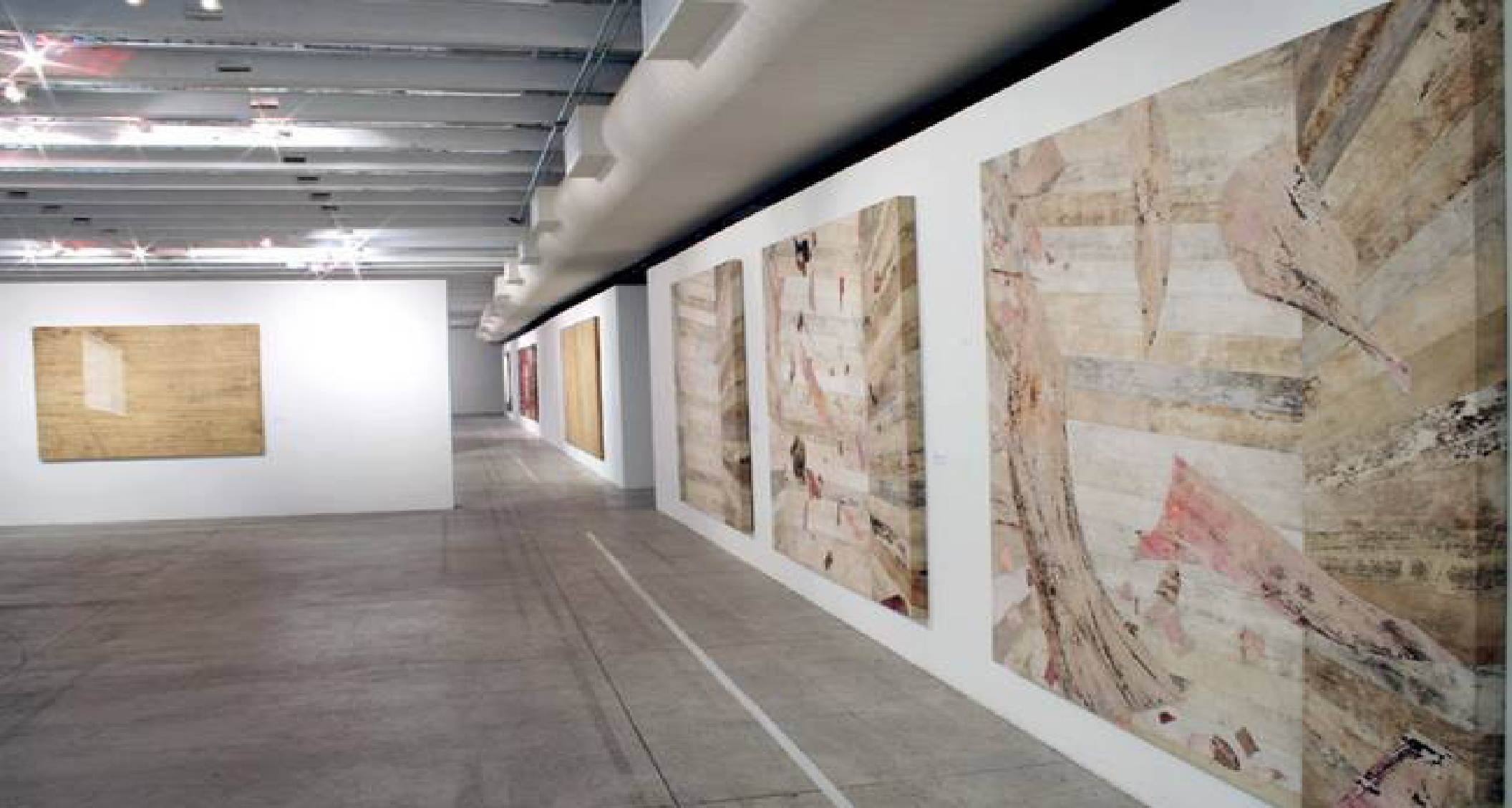
2000-2006 2006 -- vista da exposição/exhibition view -- Museu Oscar Niemeyer, Curitiba