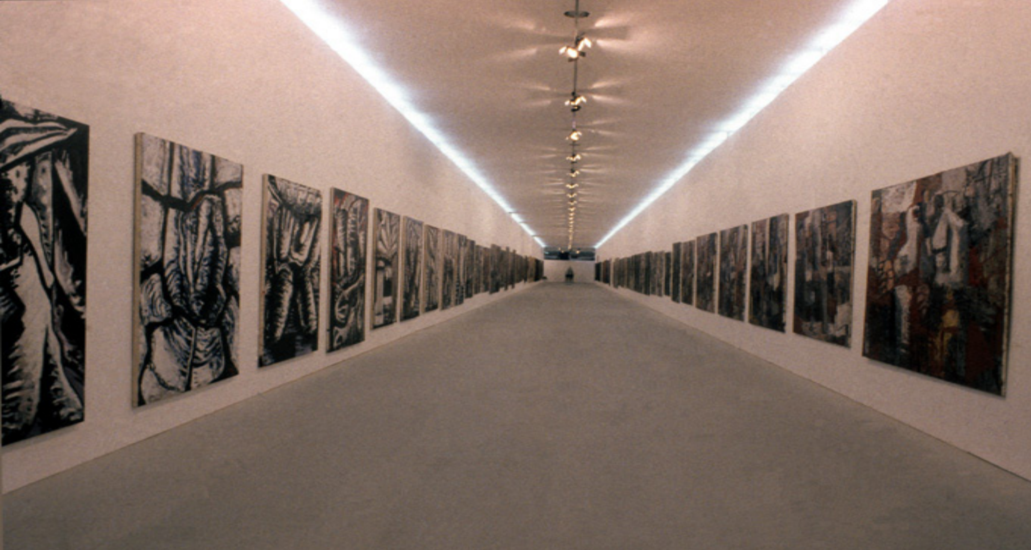
vista da exposição/exhibition view -- XVIII Bienal de São Paulo, São Paulo, 1985