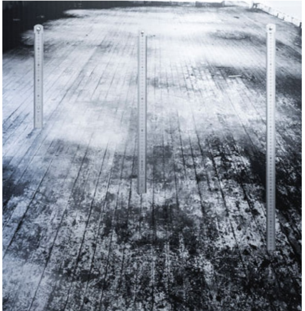
Sem título/Untitled 2013 serigrafia e aplicação de reguas de aço sobre alumínio/screen printing and steel rulers on aluminum -- 100 x 100 cm