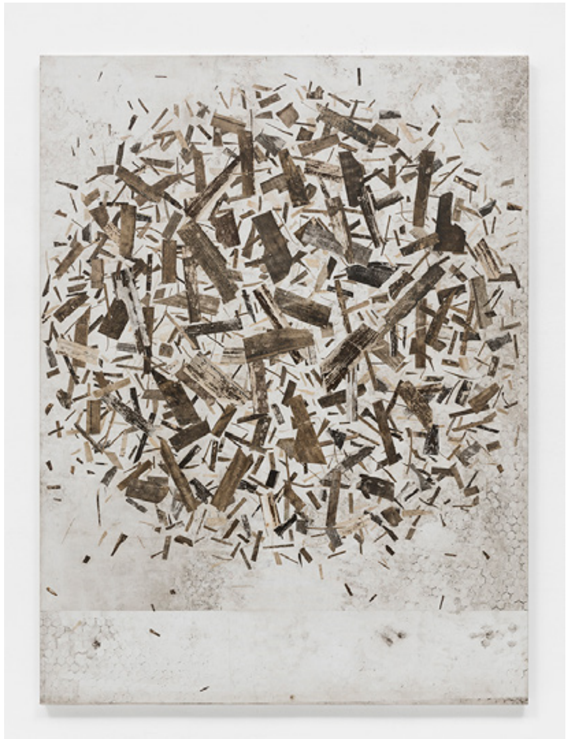
Sem título/Untitled 2016 medium acrílico e resíduos sobre tecido em colagem sobre alumínio/ acrylic medium and leavings on canvas on aluminum -- 200 x 150 cm