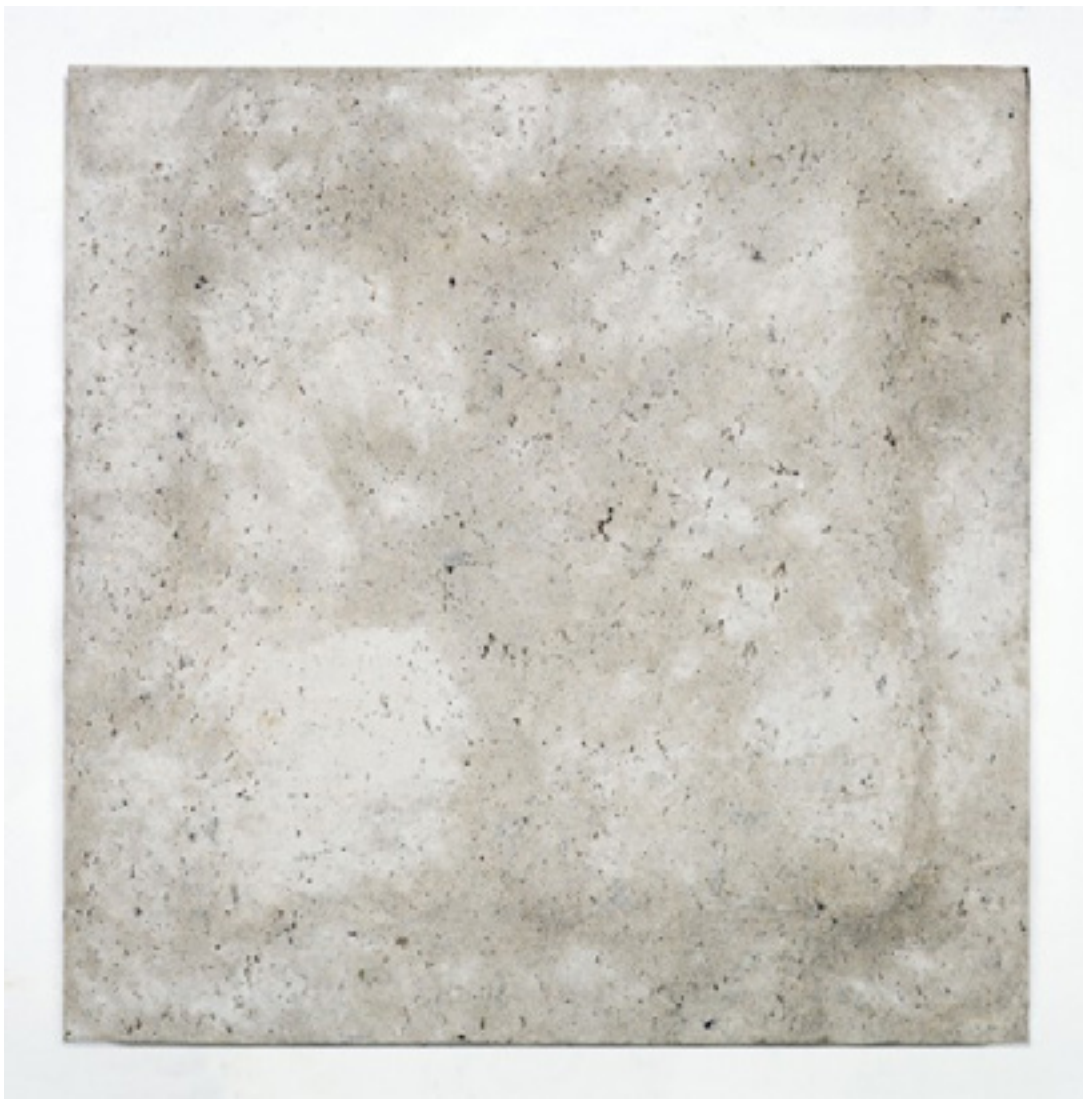
Bíblia 2015 papel reciclado de uma edição da Bíblia, cola branca e gesso/ recycled paper from an edition of The Biblia, white glue and plaster -- 80 x 80 cm