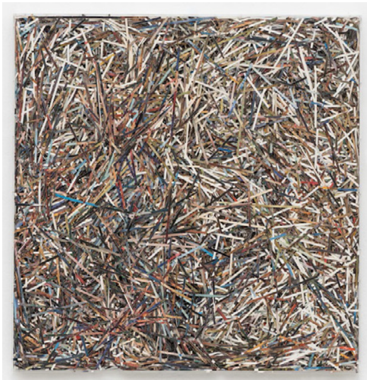
Museu (National Gallery) 2013 reproduções de obras do National Gallery fragmentadas em caixa de acrílico/ fragmented reproductions of works from the National Gallery in acrylic box -- 125 x 125 cm