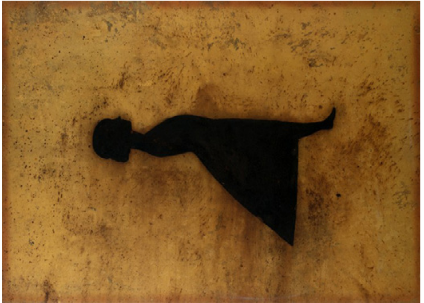
Levitação 1995 Pó de ferro e verniz poliuretânico sobre cretone/polyurethane varnish and iron dust on cretonne 170 x 240 cm