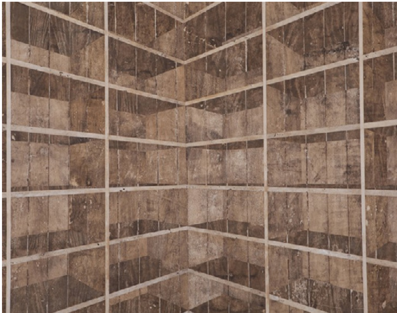
Mil 2010 medium acrílico e resíduos sobre tecido em colagem sobre alumínio/acrylic medium and residues on canvas glued onto aluminum 155 x 200 cm