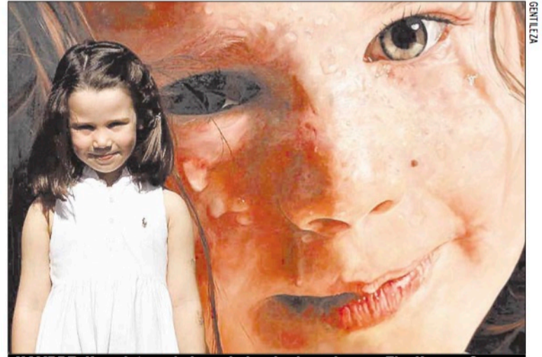
HAMBRE. Una pintura de la serie inspirada en la saga The Hunger Games.