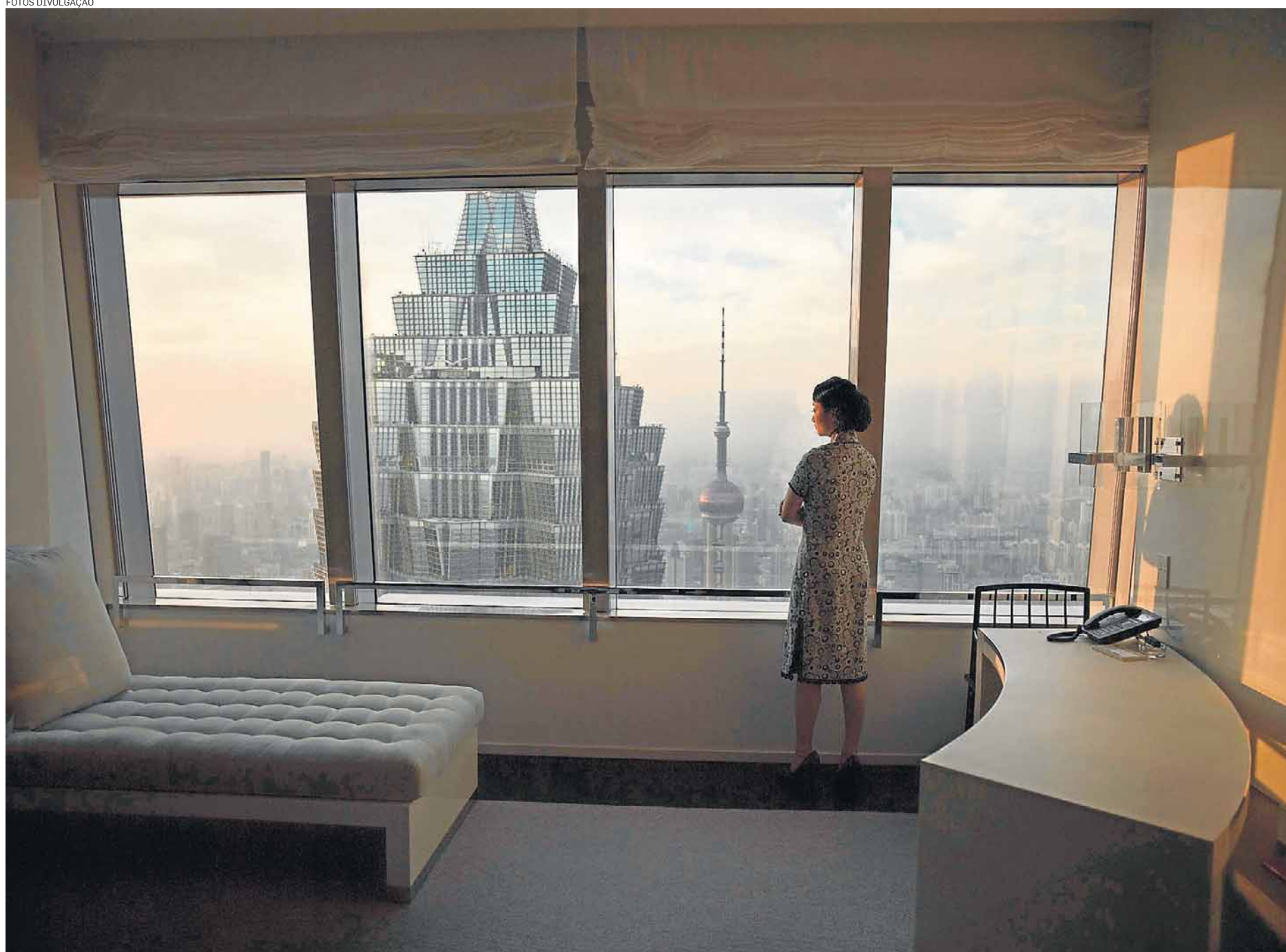
Rigor. Hotel, foto do britânico Isaac Julien, da série Ten Thousand Waves : estrangeiro exposto pela Galeria Nara Roesler