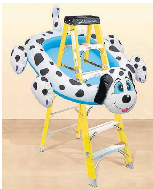
Paródico. Dogpool Ladder (2007), obra feita de alumínio e plástico pelo artista americano Jeff Koons, um dos ícones da Gagosian, galeria de Damien Hirst