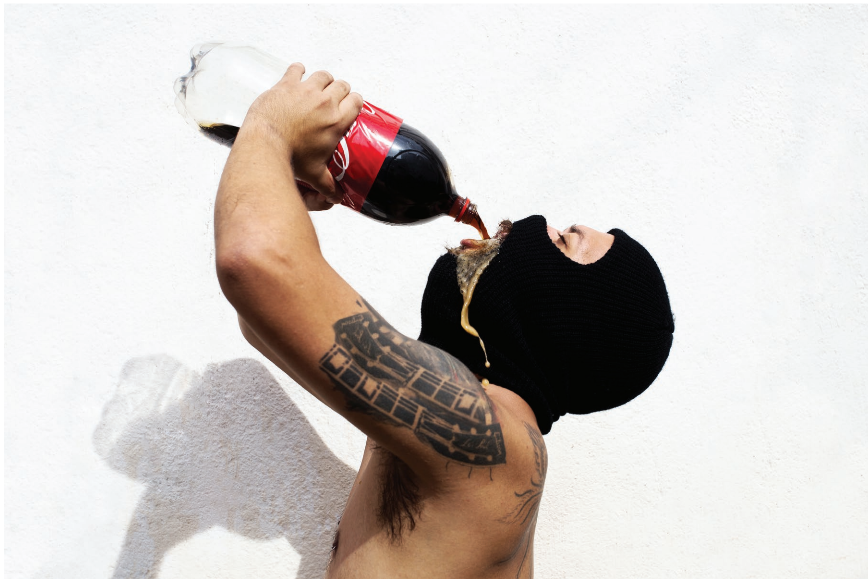
Sede de onça 2018 impressão em papel de algodão em metacrilato / print on cotton paper on methacrylate 100 x 150 cm / 39.4 x 59.1 in