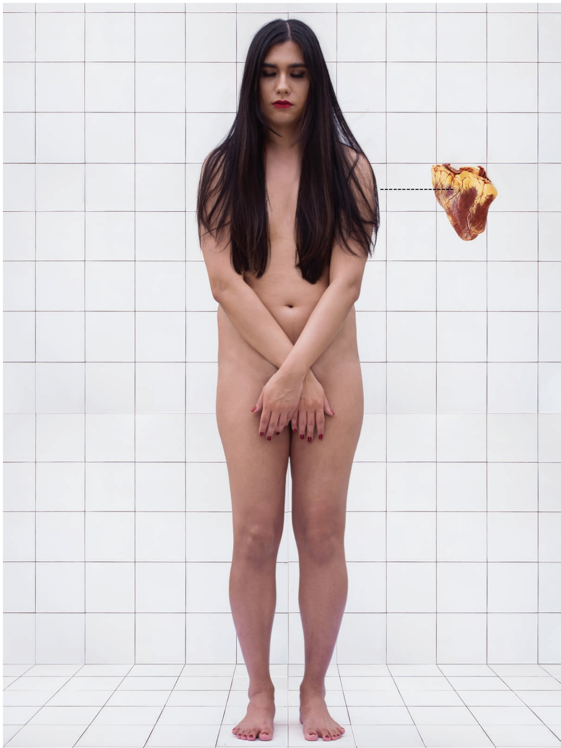
Fome de Leão 2018 impressão em papel de algodão em metacrilato / print on cotton paper on methacrylate 100 x 150 cm / 39.4 x 59.1 in