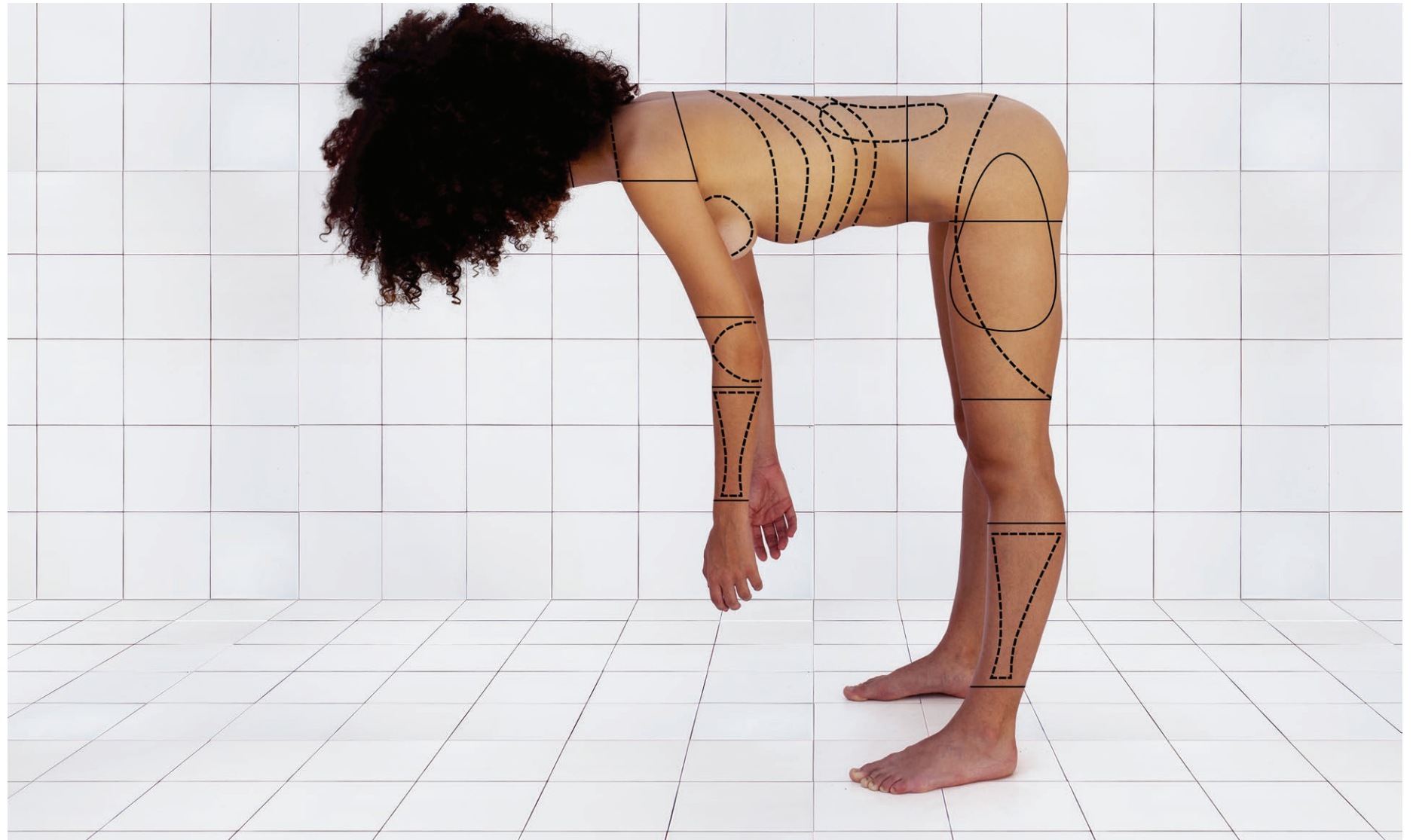
Fome de Lobo 2018 impressão em papel de algodão em metacrilato / print on cotton paper on methacrylate 100 x 150 cm / 39.4 x 59.1 in