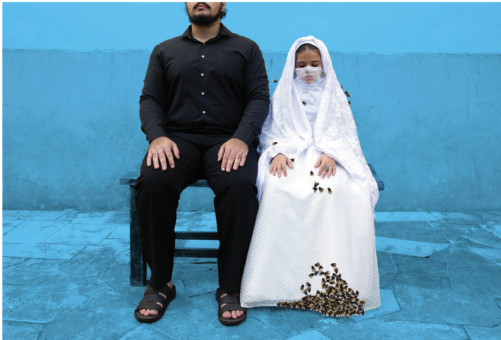
Comida Caseira 2018 impressão em papel de algodão em metacrilato / print on cotton paper on methacrylate 100 x 150 cm / 39.4 x 59.1 in