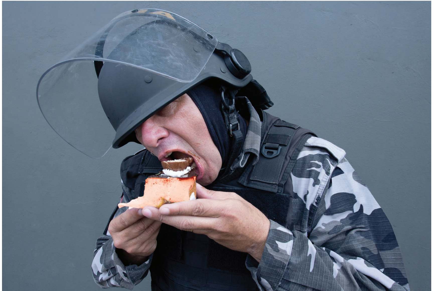
Sobremesa #4 2018 impressão em papel de algodão em metacrilato / print on cotton paper on methacrylate 100 x 150 cm / 39.4 x 59.1 in