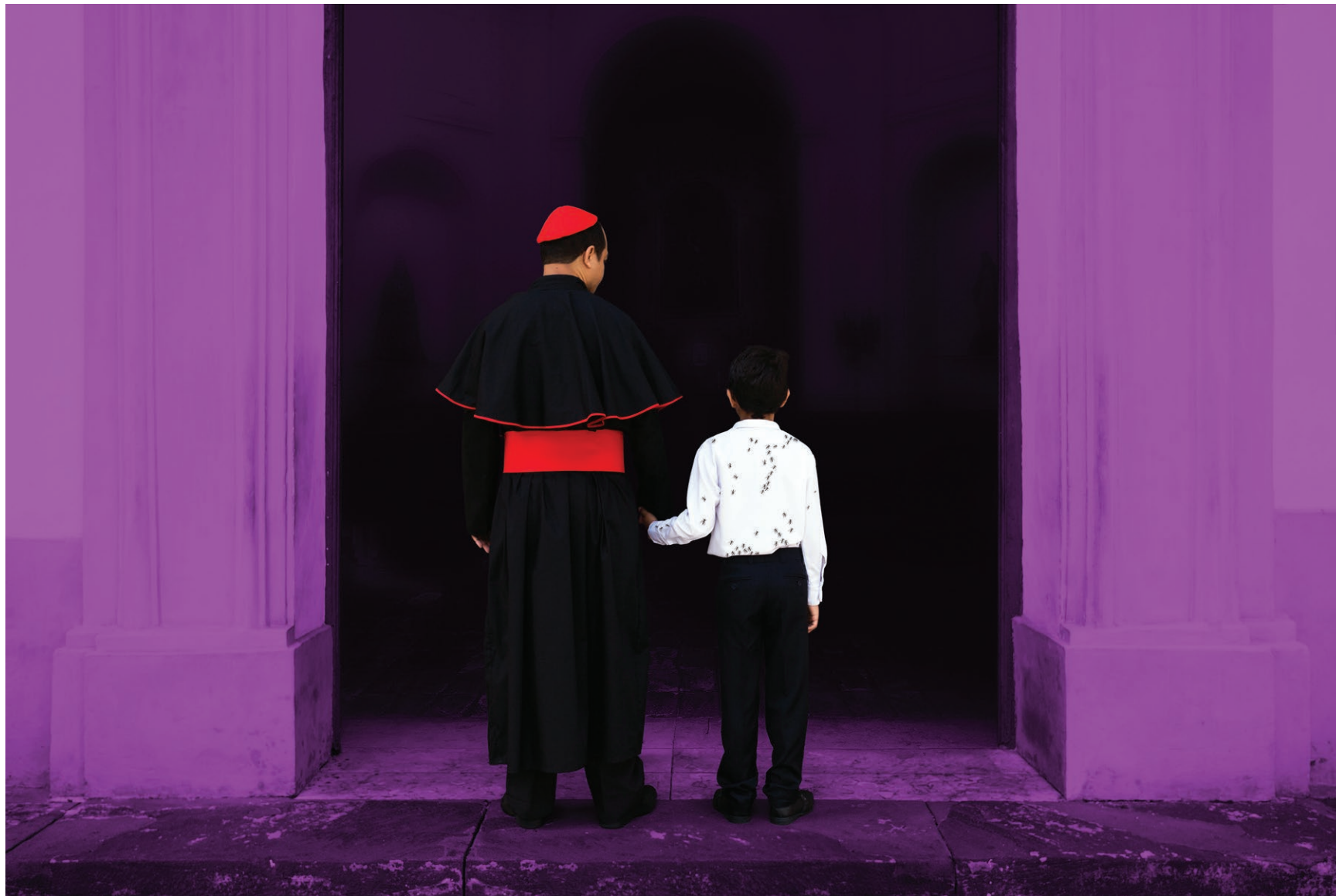
Comida Batizada 2018 impressão em papel de algodão em metacrilato / print on cotton paper on methacrylate 100 x 150 cm / 39.4 x 59.1 in