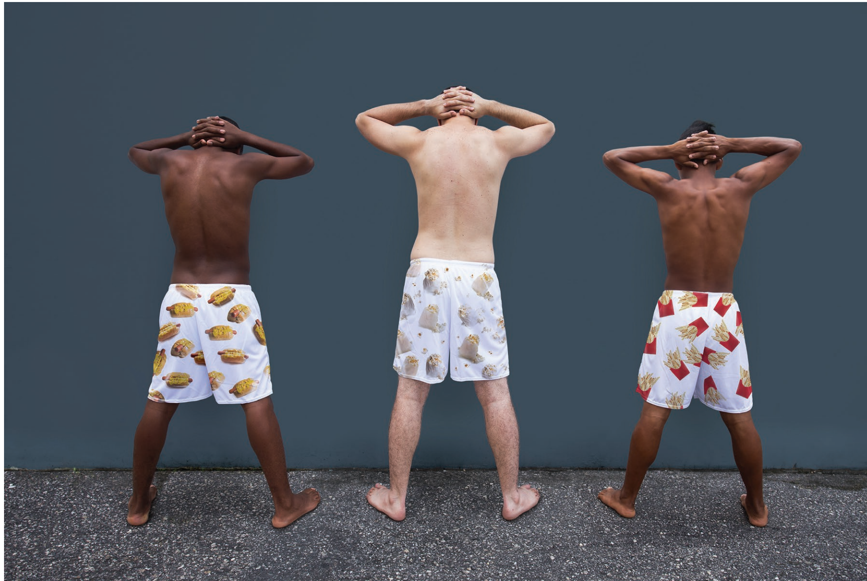
Comida de Rua #1 2018 impressão em papel de algodão em metacrilato / print on cotton paper on methacrylate 100 x 150 cm / 39.4 x 59.1 in