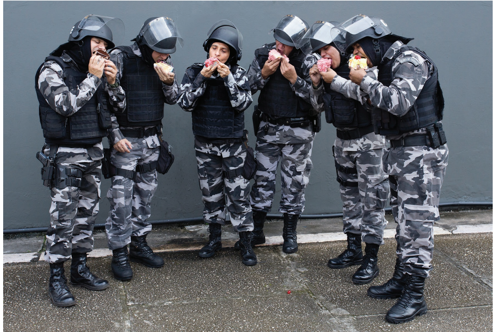
Sobremesa 2018 impressão em papel de algodão em metacrilato / print on cotton paper on methacrylate 100 x 150 cm / 39.4 x 59.1 in