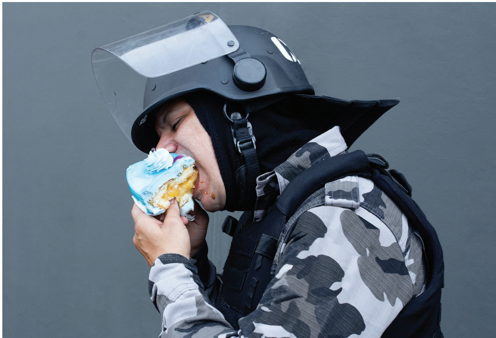
Sobremesa #2 2018 impressão em papel de algodão em metacrilato / print on cotton paper on methacrylate 100 x 150 cm / 39.4 x 59.1 in