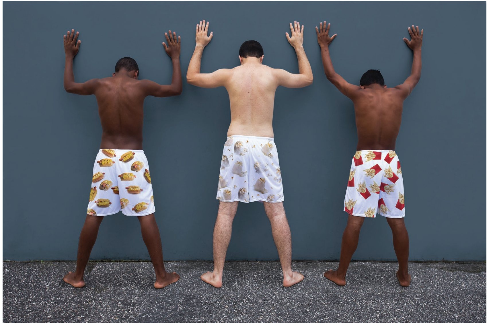
Comida de rua #2 2018 impressão em papel de algodão em metacrilato / print on cotton paper on methacrylate 100 x 150 cm / 39.4 x 59.1 in