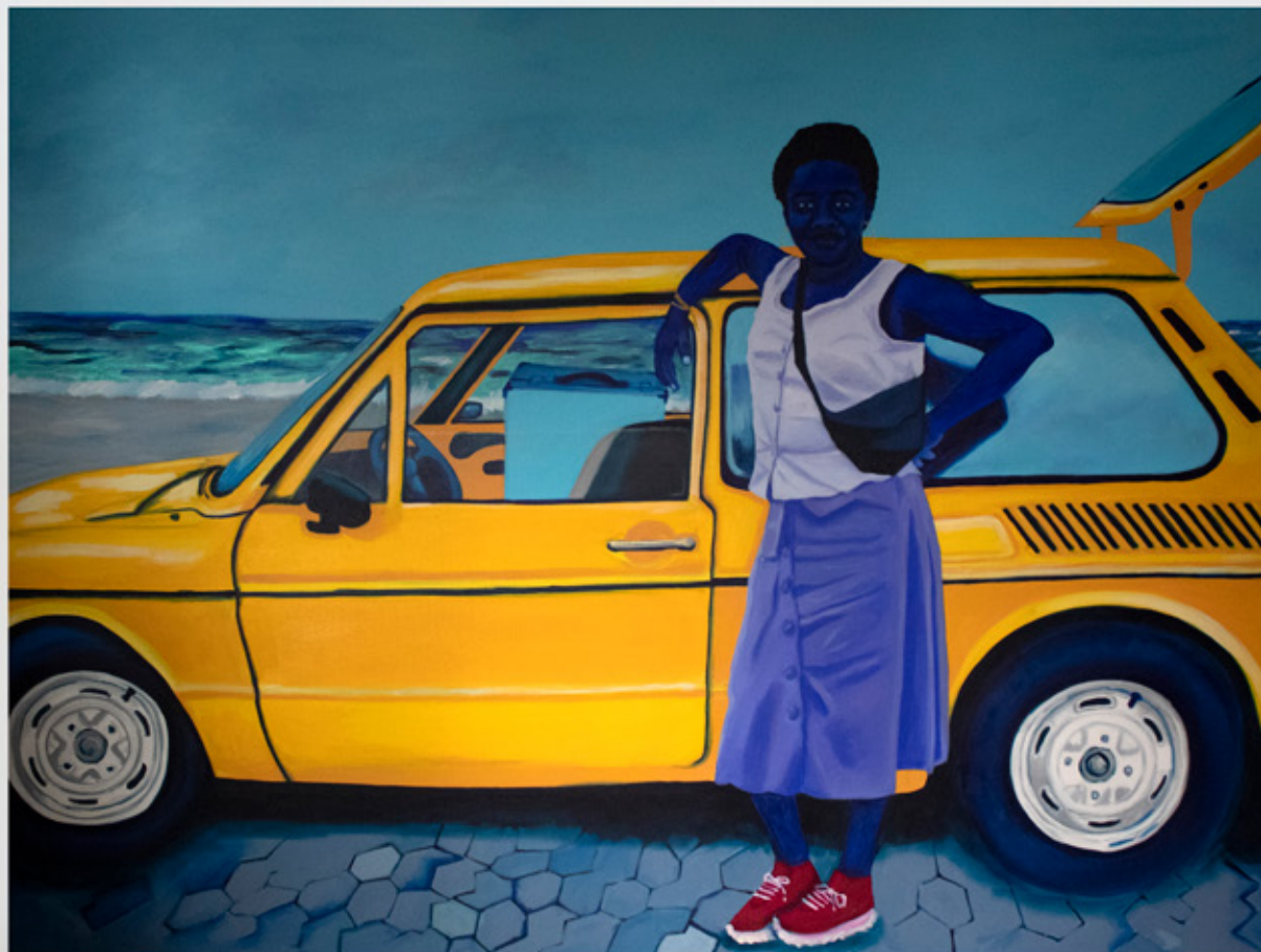
Kika Carvalho Sem título , 2021 tinta acrílica sobre tela 150 x 200 cm