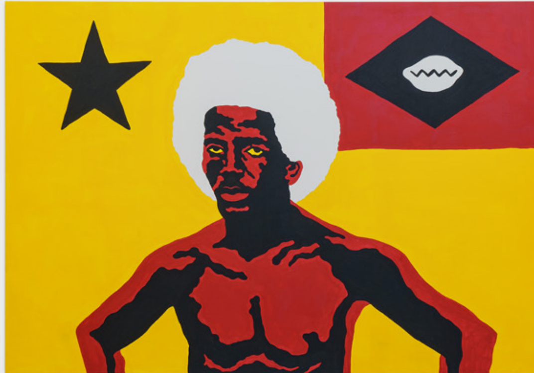
Mulambö Poder , 2021 tinta acrílica sobre tela 200 x 290 cm

Sua prática se dá a partir da refundação de potências, buscando a valorização de símbolos do existir suburbano no Rio de Janeiro. Um dos artistas mais promissores de sua geração, apresentou seus trabalhos em duas exposições individuais com grande repercussão em 2019: Tudo Nosso , no MAR – Museu de Arte do Rio; e Prato de Pedreiro , no Centro Municipal de Arte Hélio Oiticica (RJ). Em 2020, apresentou a sua primeira exposição individual em São Paulo, no Sesc-Santana. Em 2021, abriu o calendário anual de exposições da Portas Vilaseca Galeria com a sua primeira individual no espaço, Mulambö todo de ouro . No mesmo ano, foi selecionado para expor pela primeira vez fora do Brasil, no espaço Das Schaufenster, em Seattle (EUA), onde apresentou a individual Out of many, muchos más . Seus trabalhos fazem parte de importantes coleções institucionais brasileiras, como o Museu de Arte do Rio – MAR (Rio de Janeiro, RJ); a Pinacoteca do Estado de São Paulo (São Paulo, SP) e o Museu do Ingá (Niterói, RJ).