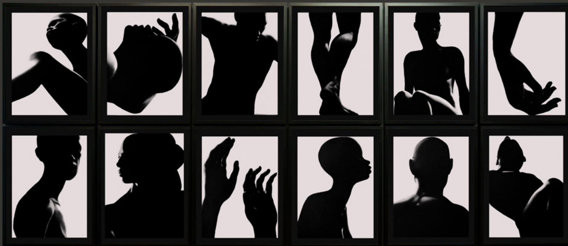
Gustavo Nazareno série Bará, 2021