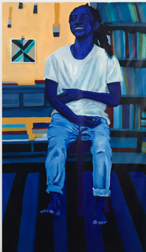
Kika Carvalho Sem título , 2021 tinta acrílica sobre tela 150 x 100 cm