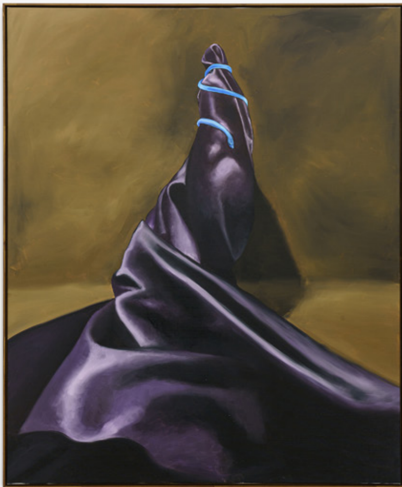
Gustavo Nazareno Oxumaré , 2021 tinta óleo sobre linho 155 x 127 cm