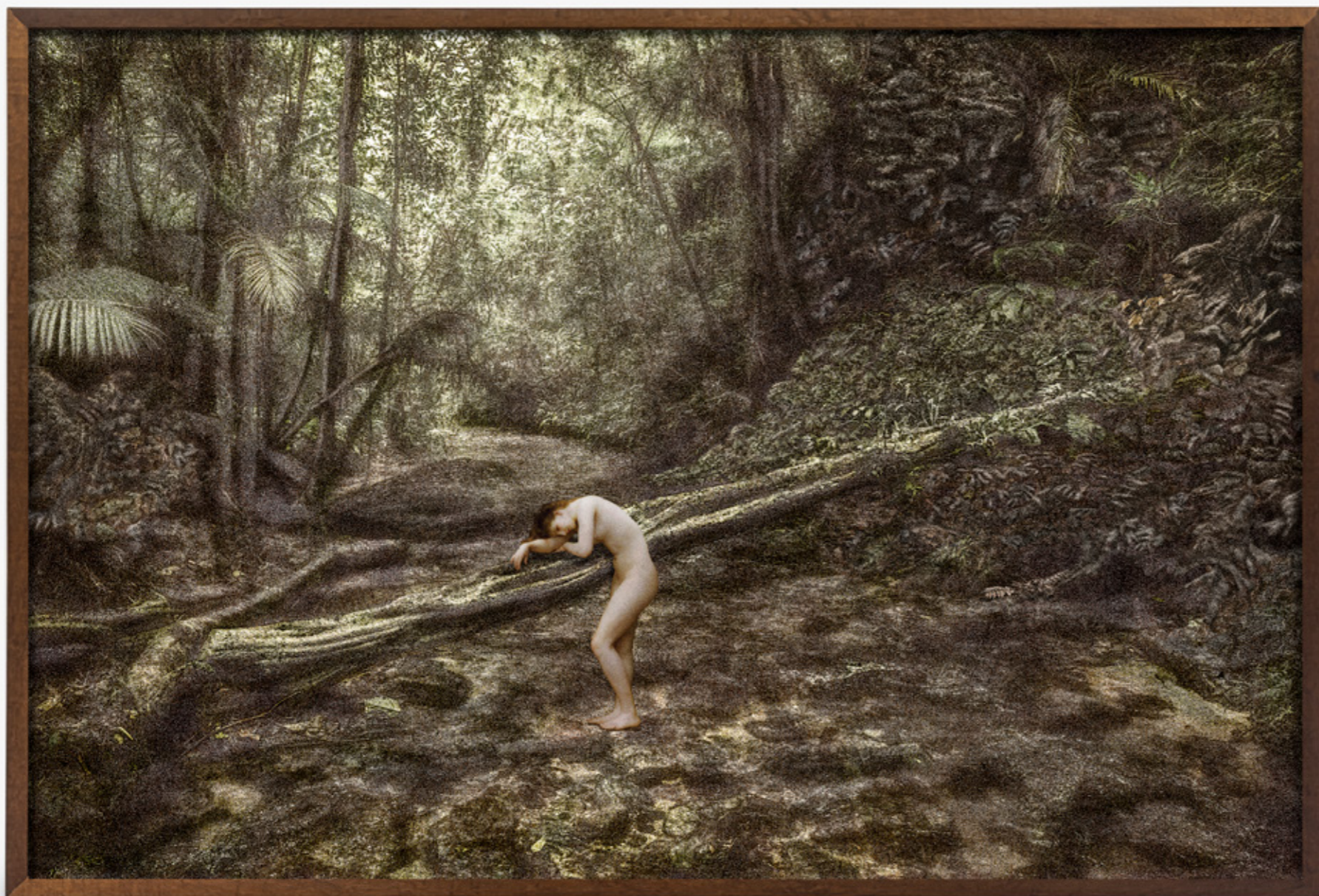
Dríades # 13/Dryads # 13 , 2019 impressão jato de tinta sobre papel de algodão inkjet print on cotton paper 100 x 150 cm/39.4 x 59.1 in edição de 5 + 2 PA/edition of 5 + 2 AP