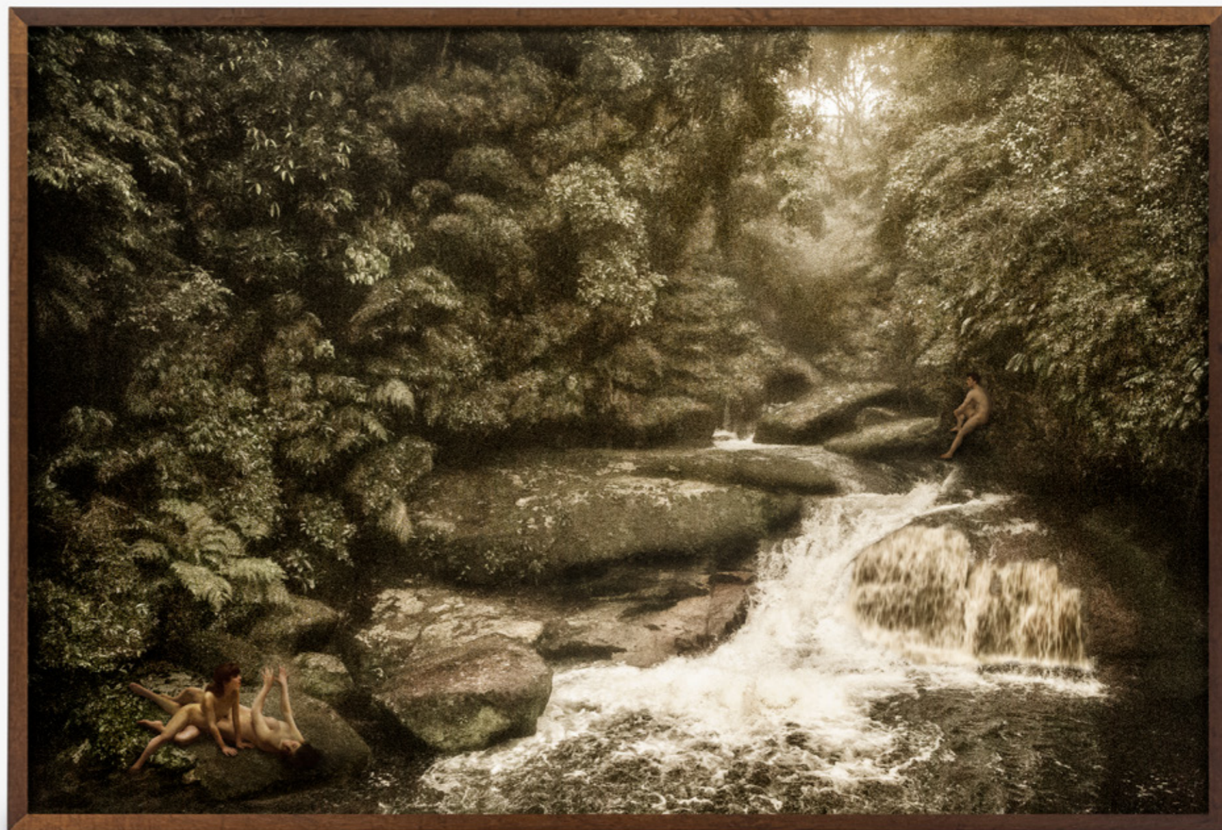
Dríades # 05/Dryads # 05 , 2019 impressão jato de tinta sobre papel de algodão inkjet print on cotton paper 75 x 112 cm/29.5 x 44.1 in edição de 5 + 2 PA/edition of 5 + 2 AP