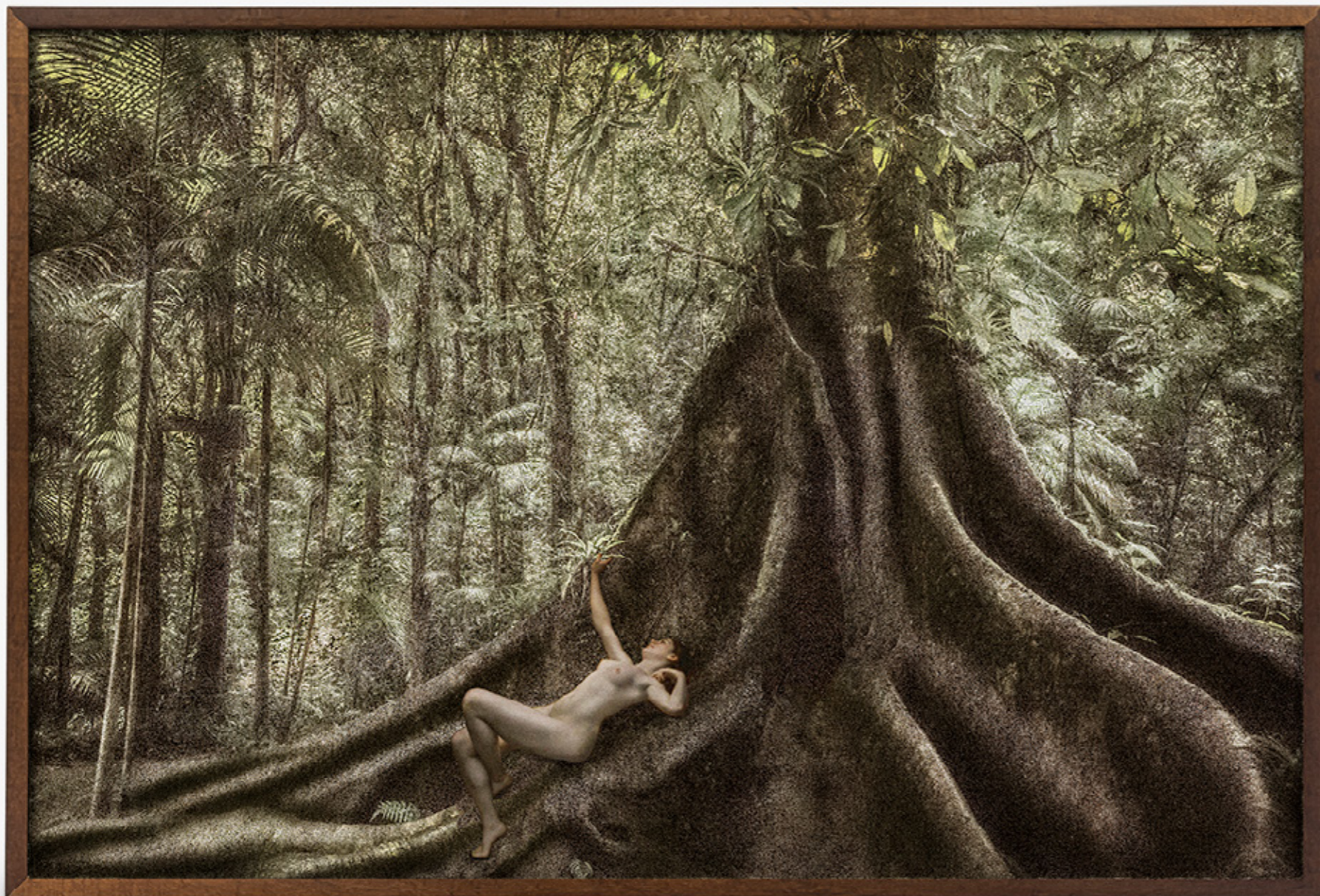
Dríades # 02/Dryads # 02 , 2019 impressão jato de tinta sobre papel de algodão inkjet print on cotton paper 150 x 220 cm/59.1 x 86.6 in edição de 5 + 2 PA/edition of 5 + 2 AP