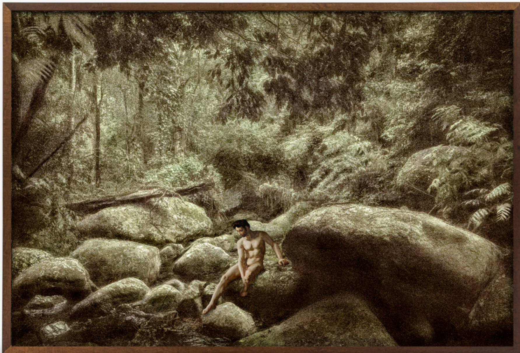
Faunos # 03/Fauns # 03 , 2019 impressão jato de tinta sobre papel de algodão inkjet print on cotton paper 100 x 150 cm/39.4 x 59.1 in edição de 5 + 2 PA/edition of 5 + 2 AP