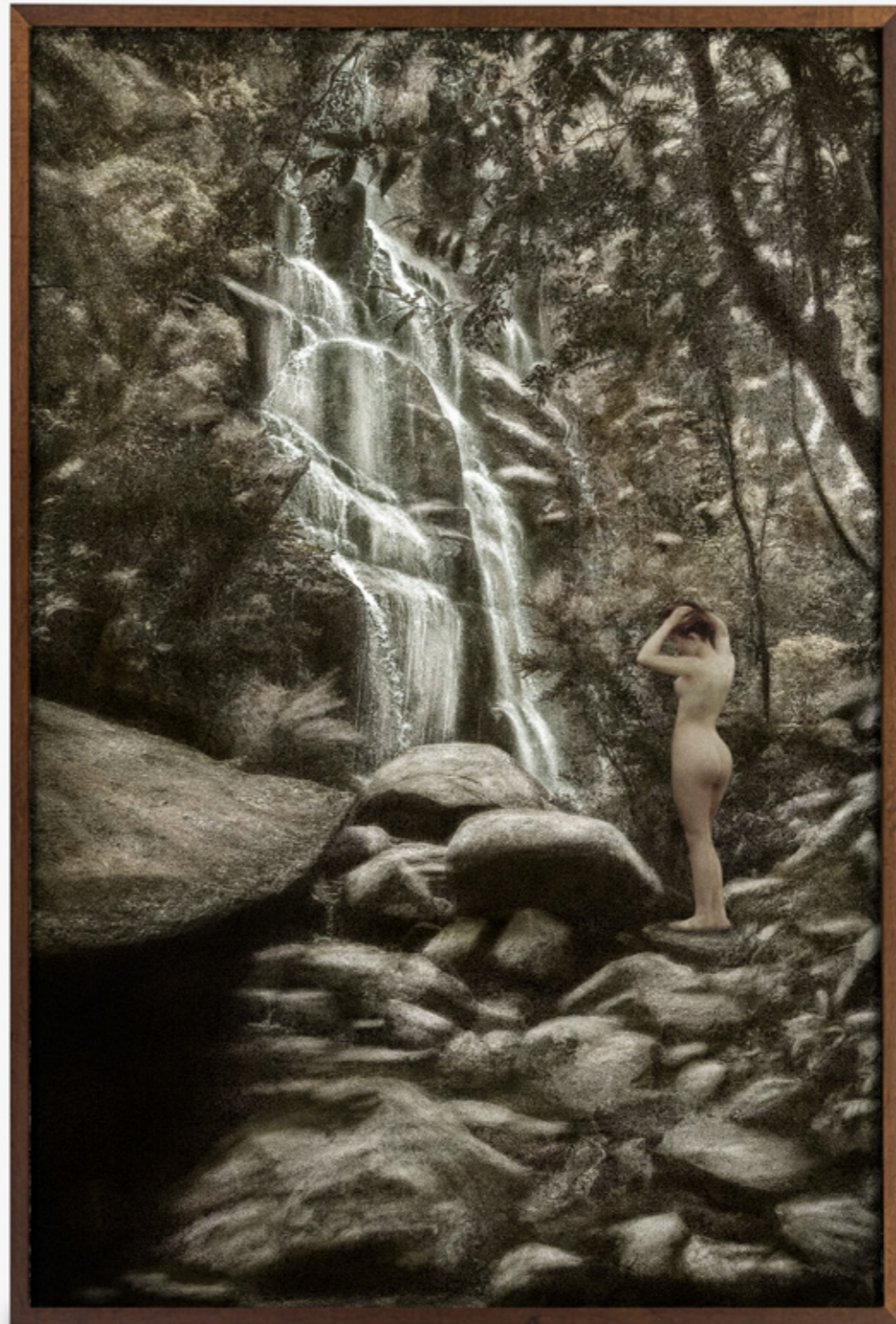
Dríades # 07/Dryads # 07 , 2019 impressão jato de tinta sobre papel de algodão inkjet print on cotton paper 150 x 100 cm/59.1 x 39.4 in edição de 5 + 2 PA/edition of 5 + 2 AP