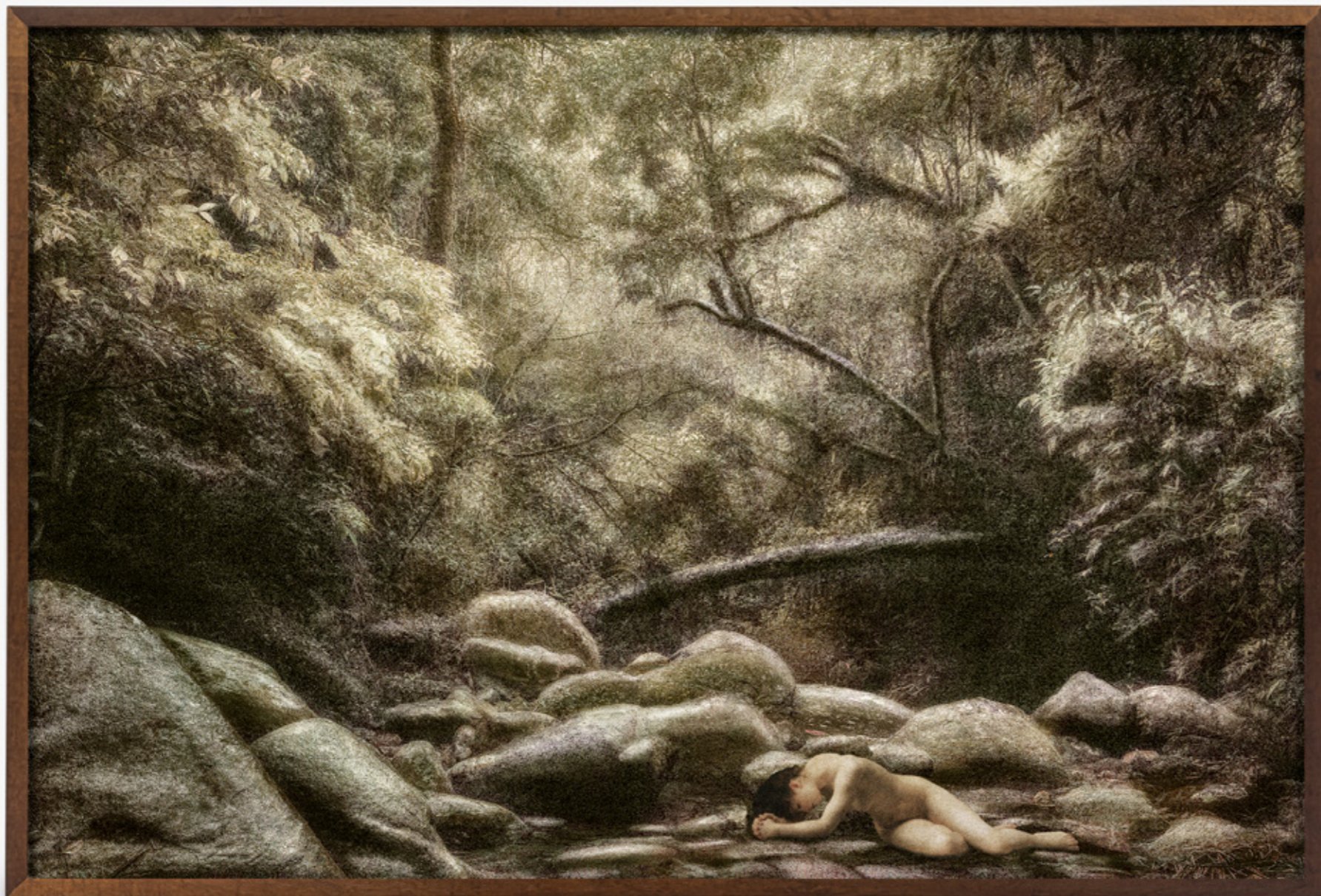
Dríades # 10/Dryads # 10 , 2019 impressão jato de tinta sobre papel de algodão inkjet print on cotton paper 100 x 150 cm/39.4 x 59.1 in edição de 5 + 2 PA/edition of 5 + 2 AP