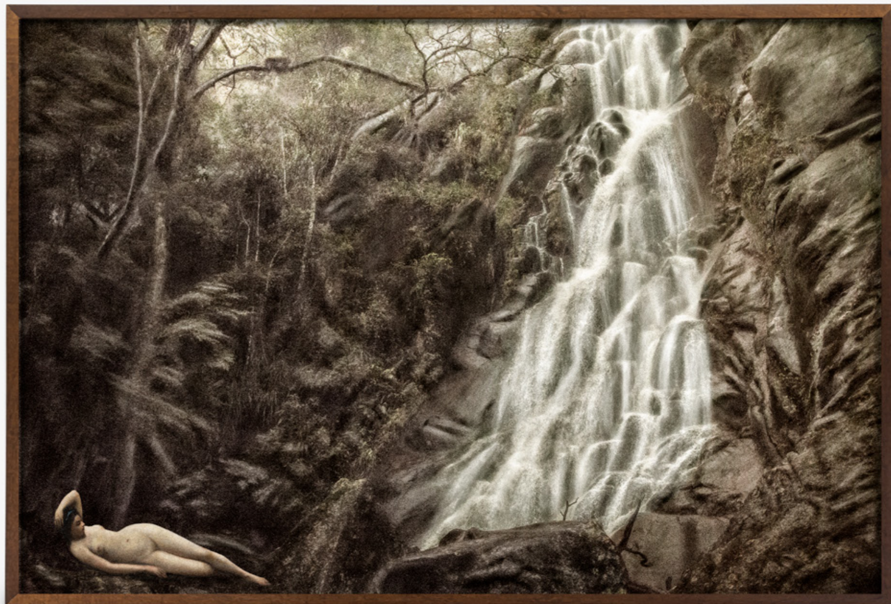
Dríades # 01/Dryads # 01 , 2019 impressão jato de tinta sobre papel de algodão inkjet print on cotton paper 75 x 112 cm/29.5 x 44.1 in edição de 5 + 2 PA/edition of 5 + 2 AP