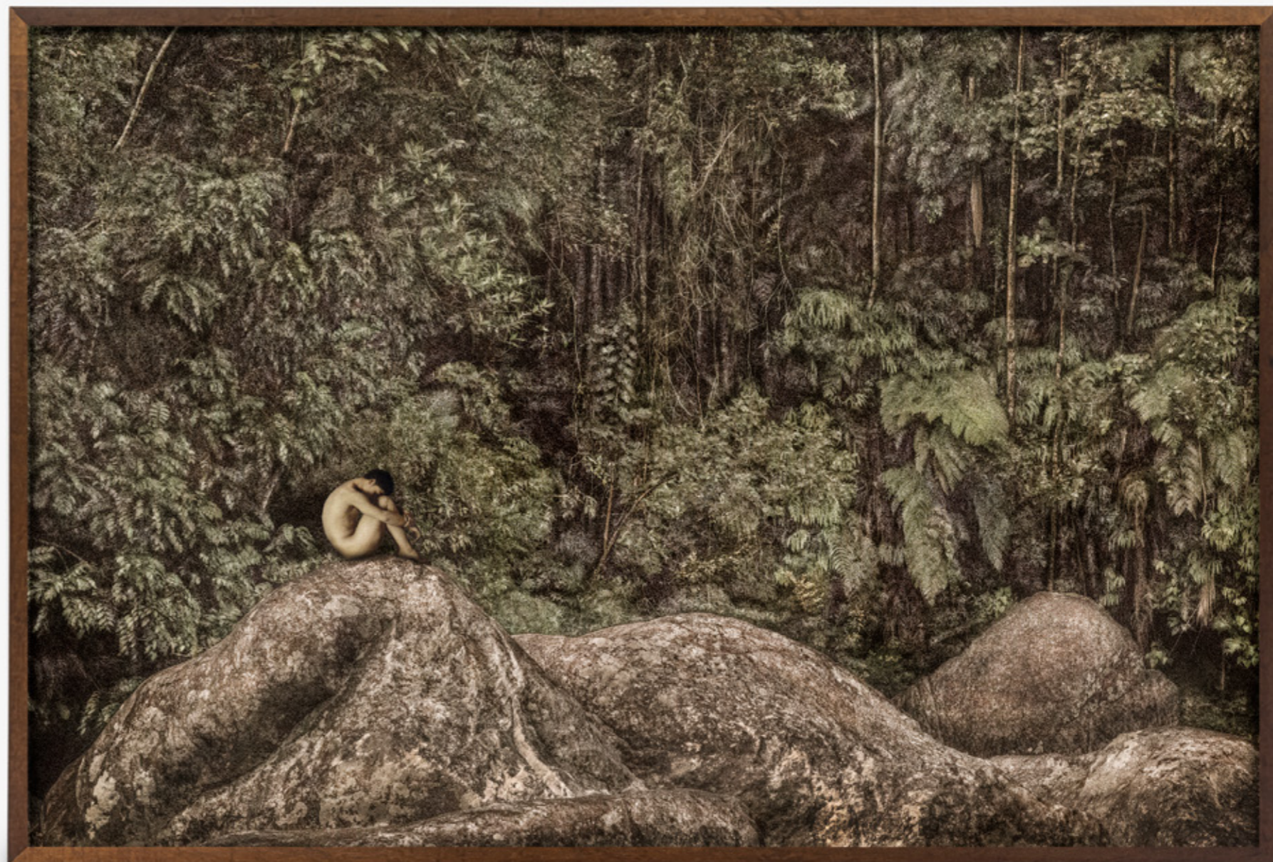
Faunos # 04/Fauns # 04 , 2019 impressão jato de tinta sobre papel de algodão inkjet print on cotton paper 75 x 112 cm/29.5 x 44.1 in edição de 5 + 2 PA/edition of 5 + 2 AP