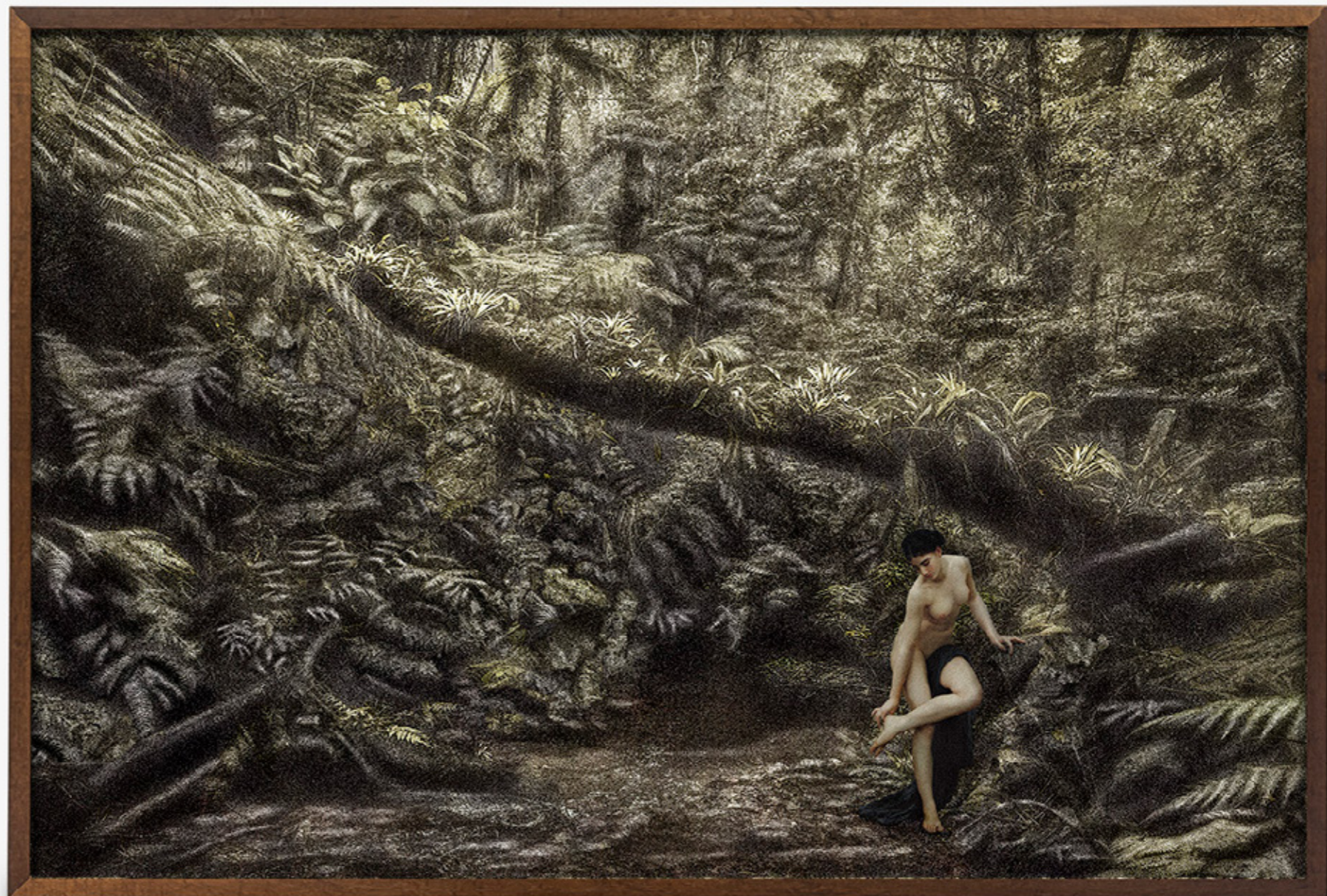
Dríades # 11/Dryads # 11 , 2019 impressão jato de tinta sobre papel de algodão inkjet print on cotton paper 100 x 150 cm/39.4 x 59.1 in edição de 5 + 2 PA/edition of 5 + 2 AP