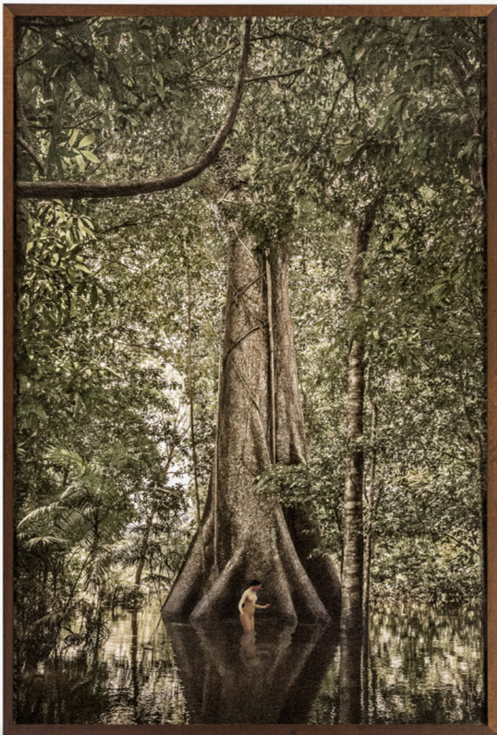
Dríades # 17/Dryads # 17 , 2019 impressão jato de tinta sobre papel de algodão inkjet print on cotton paper 220 x 150 cm/86.6 x 59.1 in edição de 5 + 2 PA/edition of 5 + 2 AP