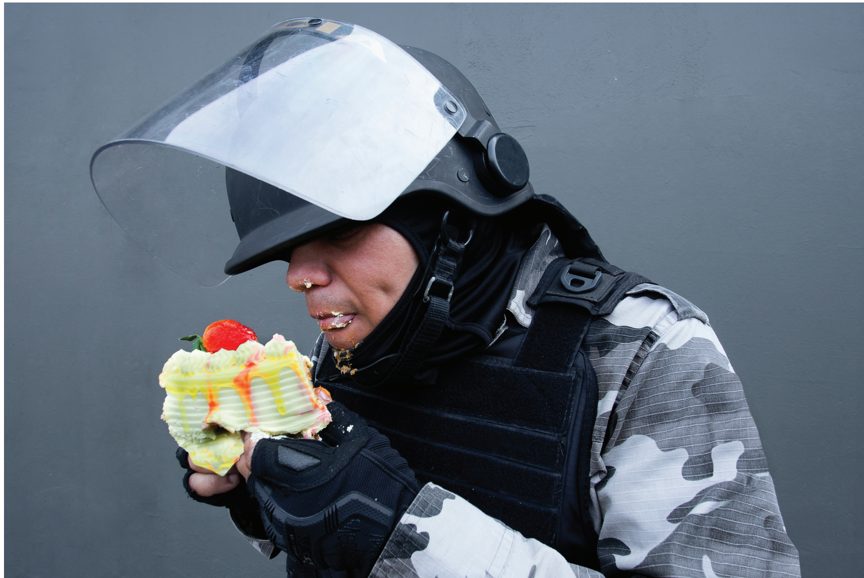
Sobremesa #3 2018 impressão em papel de algodão em metacrilato / print on cotton paper on methacrylate 100 x 150 cm / 39.4 x 59.1 in