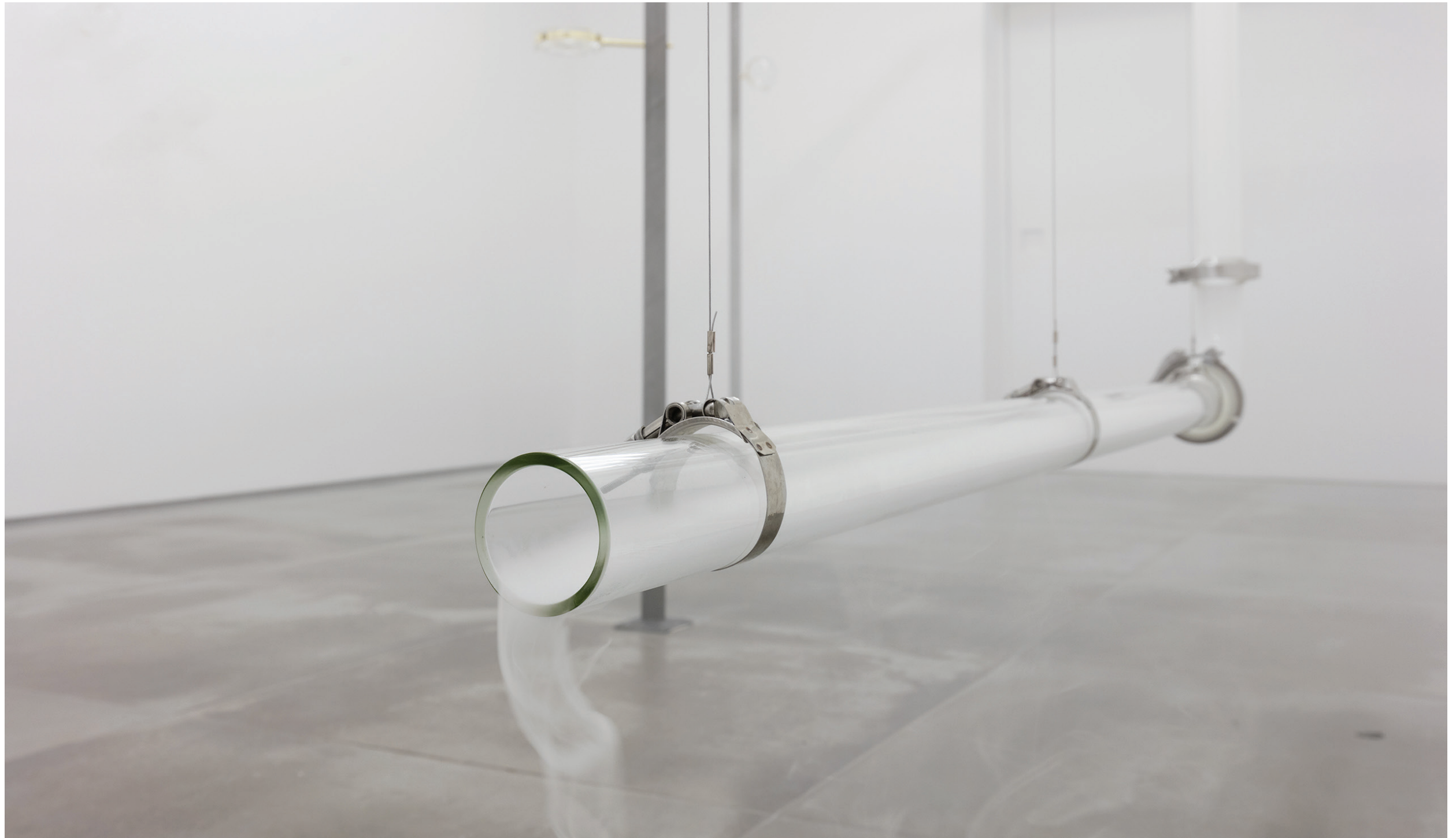
Morro Mundo , 2017 tubos de vidro, máquina de fumaça dimensões variáveis