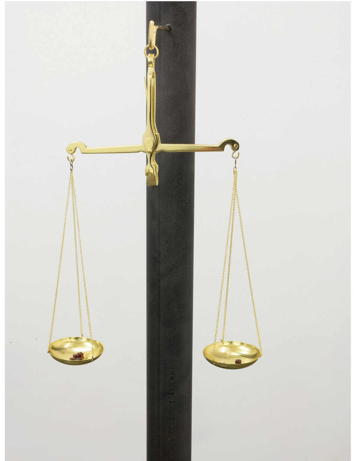
Duas Medidas , 2017 latão banhado a ouro, estilhaços de granada ed PA