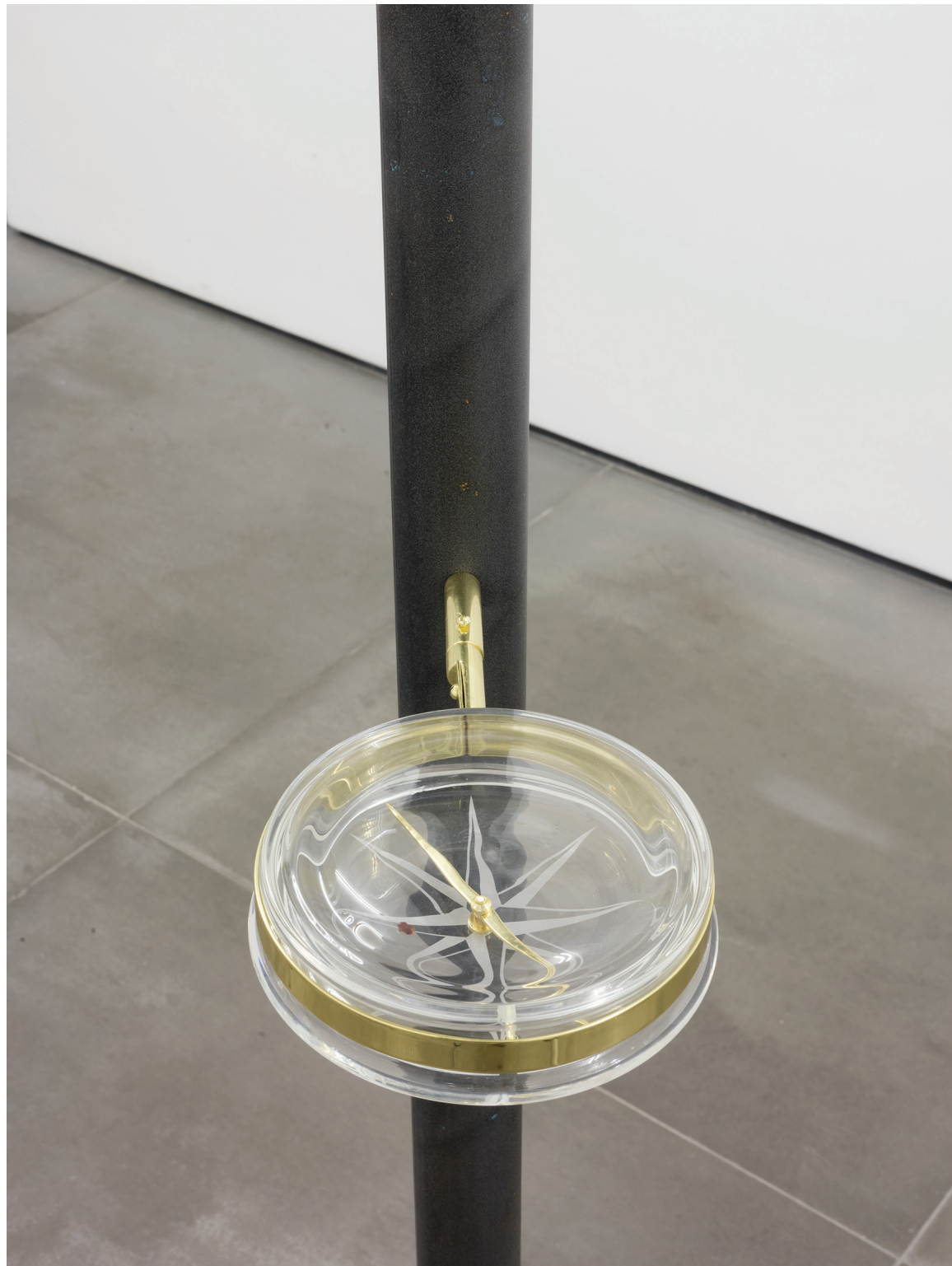
Bússola , 2017 vidro borossilicato serigrafado, latão banhado a ouro ed 1/5 + 1 PA