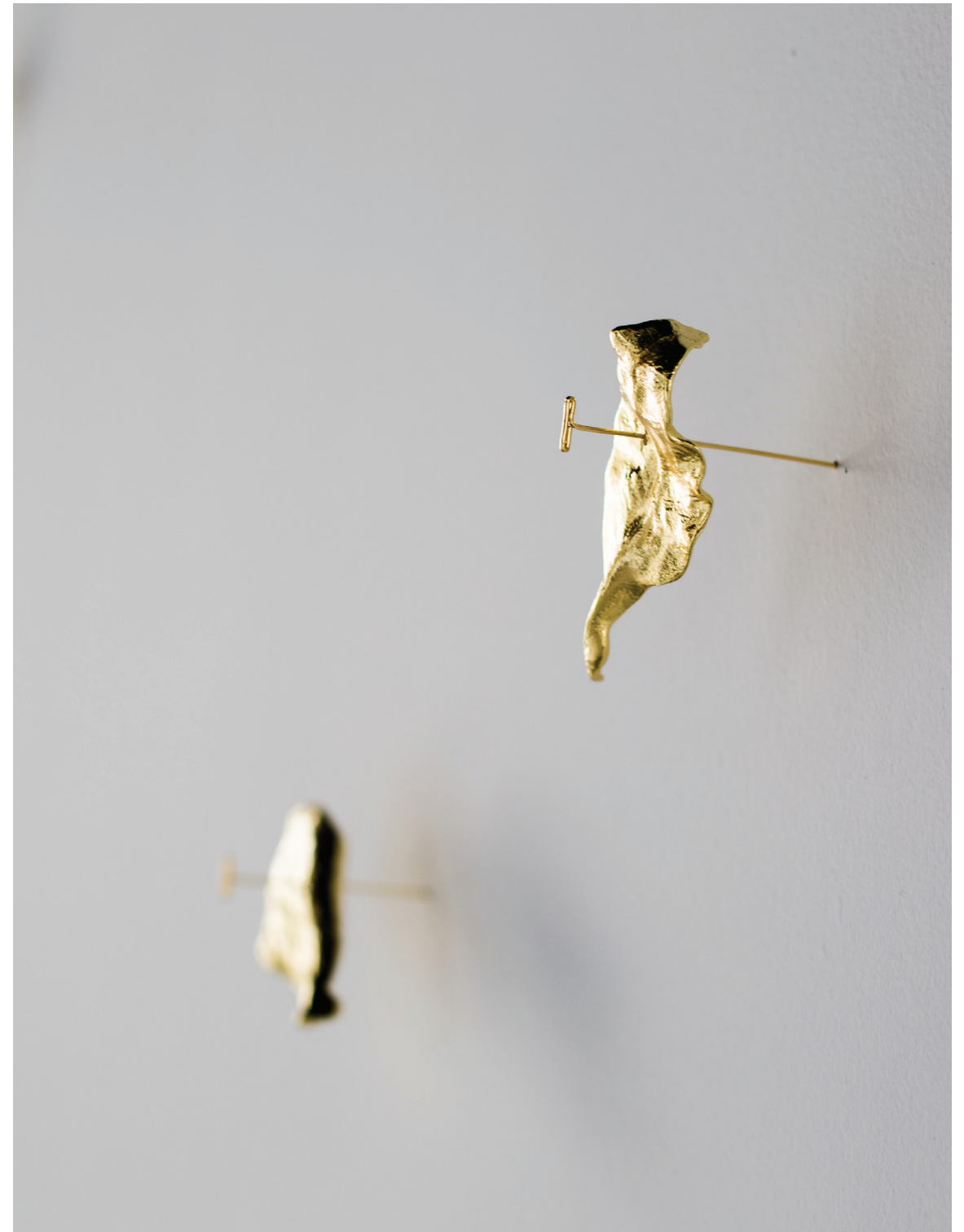
Folhas Avulsas # 1 , 2018 latão fundido com banho de ouro 3 peças de 12 x 5 x 8 cm (cada)