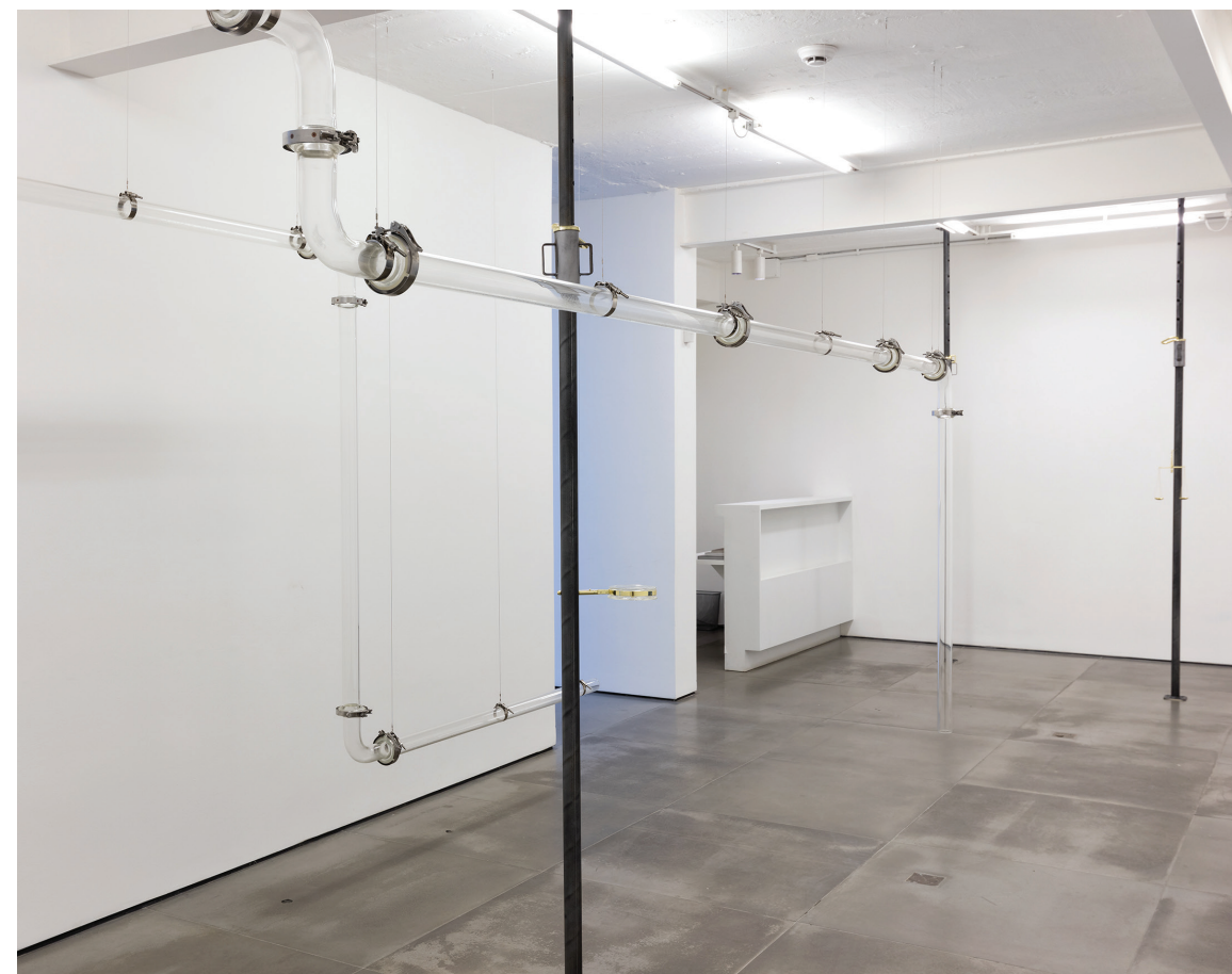
vista da exposição -- galeria nara roesler | rio de janeiro, 2017

A sua máquina programada para soltar fumaça à medida que seus sensores de presença são ativados, revela-se ao espectador pelos tubos de vidro que atravessam todo o espaço expositivo. Diferentemente de outros trabalhos com vapor d'água, como a artista realizou no MuBE e no Beco do Pinto, em São Paulo, nesta instalação o vapor é anunciado antes de se dispersar no ar. Assim os visitantes podem assistir à fumaça em situação também de controle, antes de ser tragado por ela.