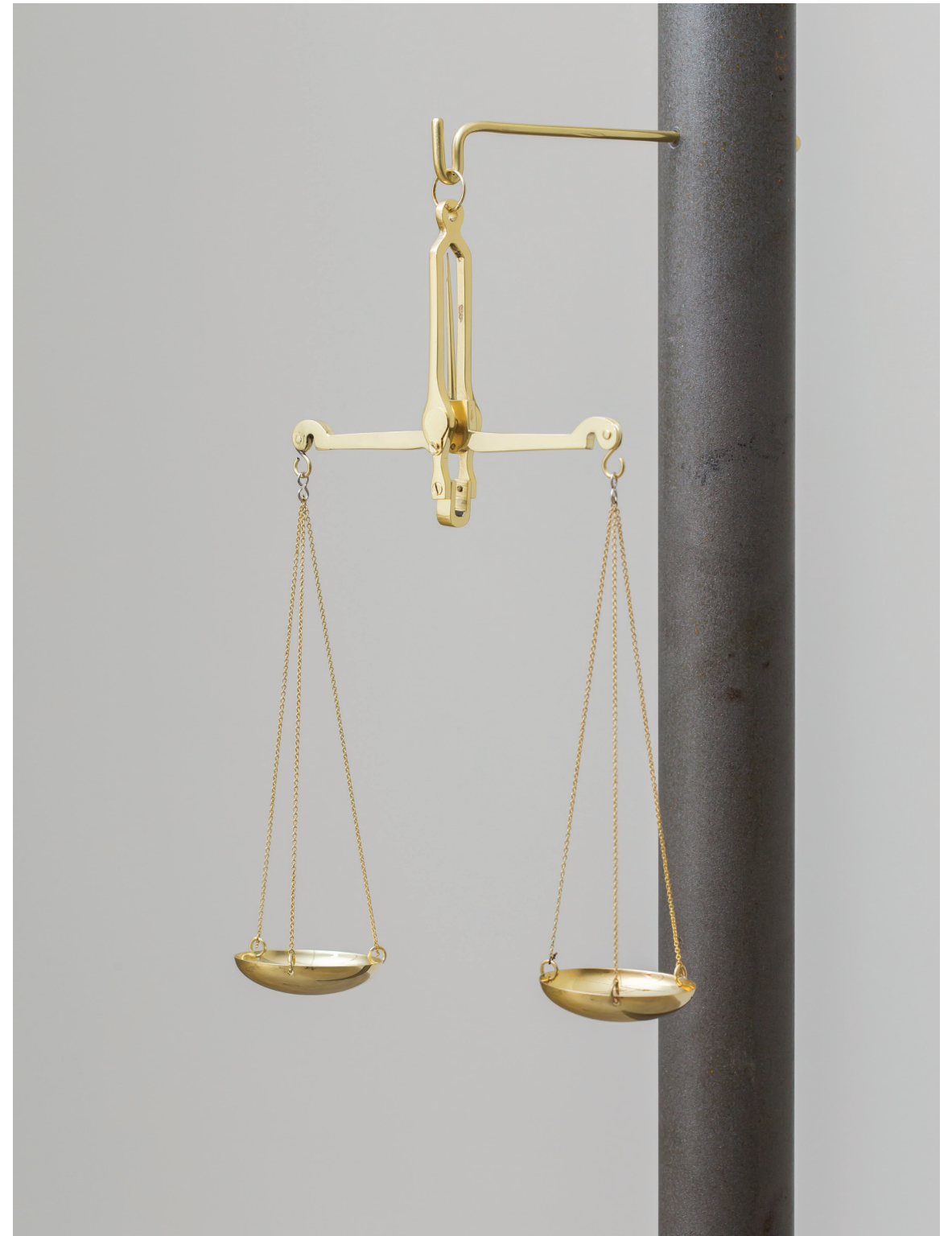
Duas Medidas , 2017 latão banhado a ouro, estilhaços de granada ed PA