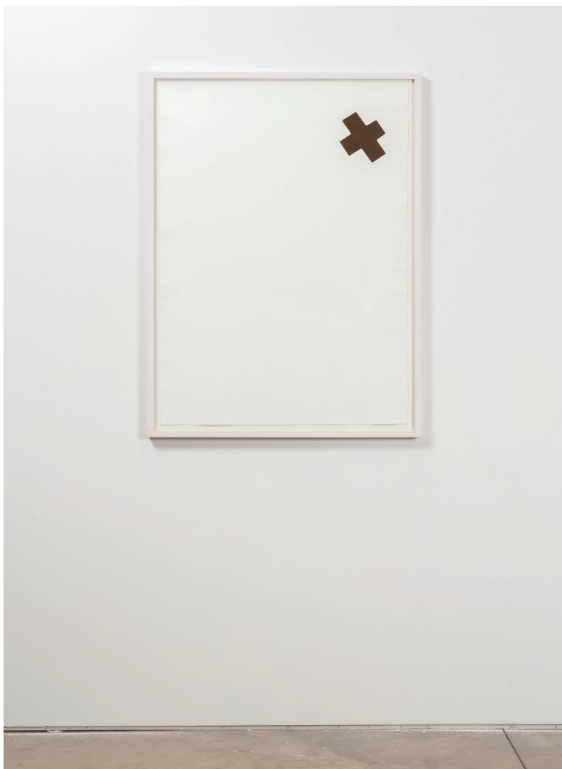
X vermelho , 2017 água tinta e água forte sobre papel hahnemuhle 100% algodão ed 1/5 + 1 PA 125 x 80 cm