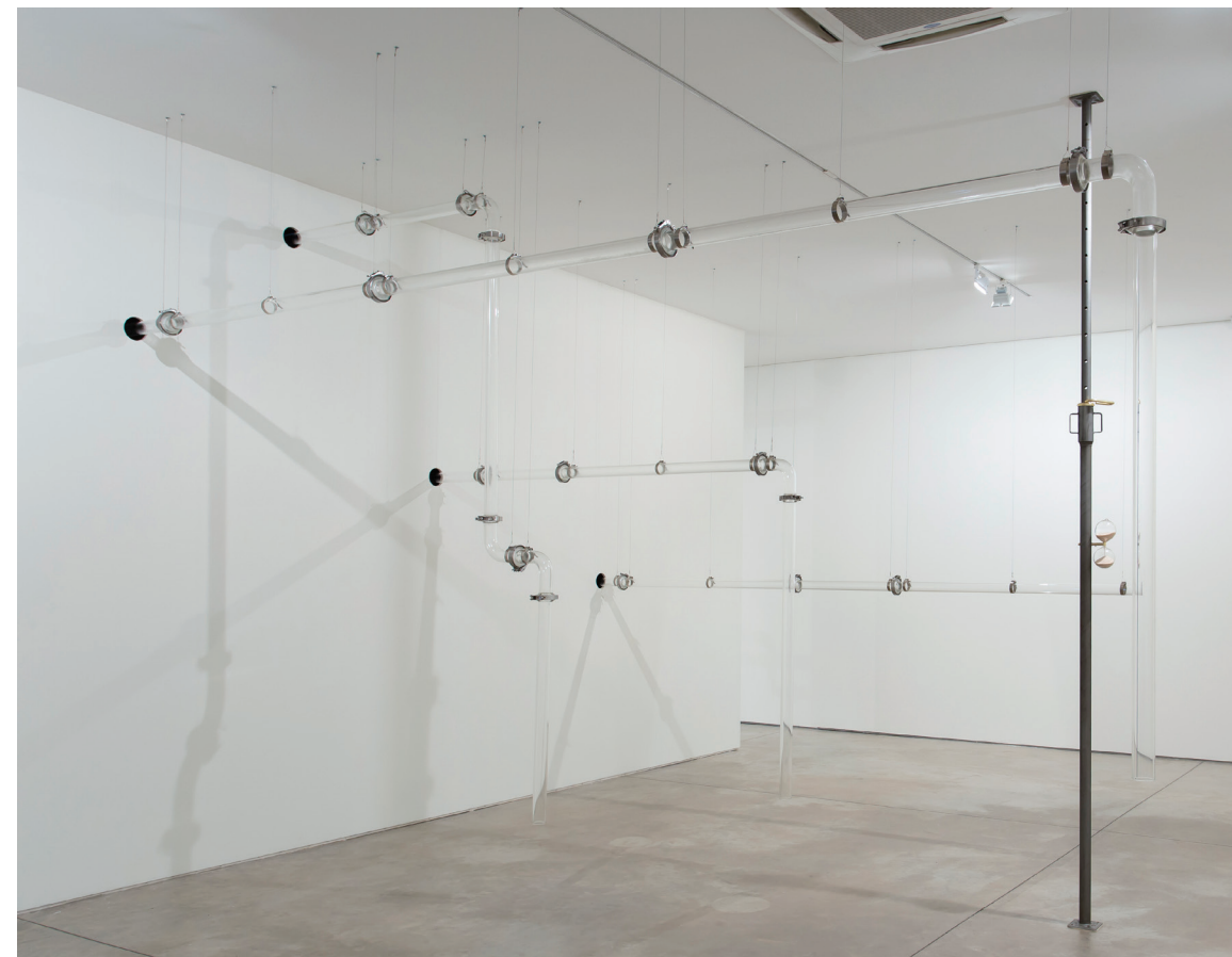
Morro Mundo , 2017 tubos de vidro, máquina de fumaça dimensões variáveis

Morro Mundo , de Laura Vinci irá ocupar a Galeria Nara Roesler | Rio de Janeiro com uma suave massa de fumaça branca e convidar o visitante à experiência de desorientar-se no espaço e reorientar-se no corpo. A sua máquina programada para soltar fumaça à medida que seus sensores de presença são ativados, revela-se ao espectador pelos tubos de vidro que atravessam todo o espaço expositivo. Nesta instalação o vapor é anunciado antes de se dispersar no ar. Assim os tubos não só anunciam a experiência, como também são vitrines por onde o olho pode captar a fumaça em situação de controle. Depois de expelida, a fumaça domina o espaço, tornando as tubulações quase invisíveis para aquele que assiste à cena ao mesmo tempo que é tragado pela névoa.