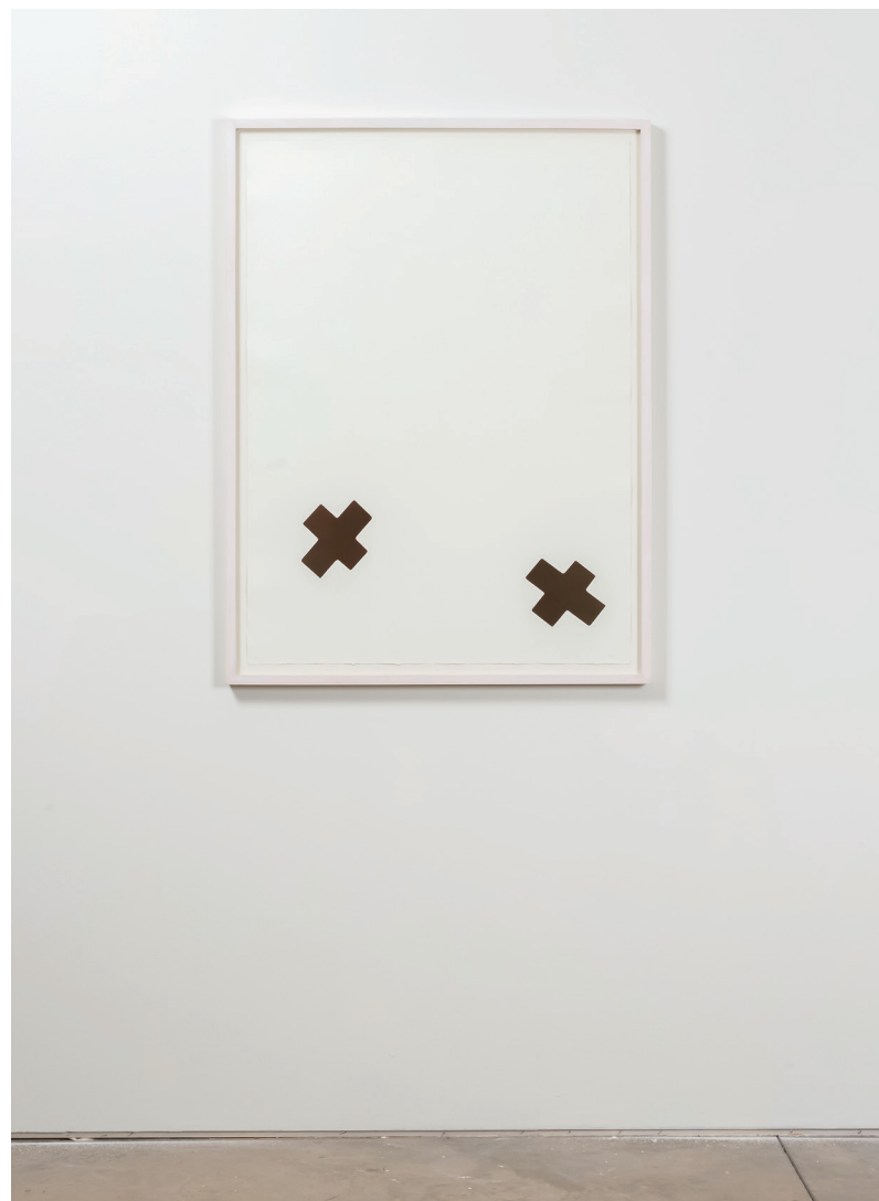
X vermelho , 2017 água tinta e água forte sobre papel hahnemuhle 100% algodão ed 1/5 + 1 PA 125 x 80 cm