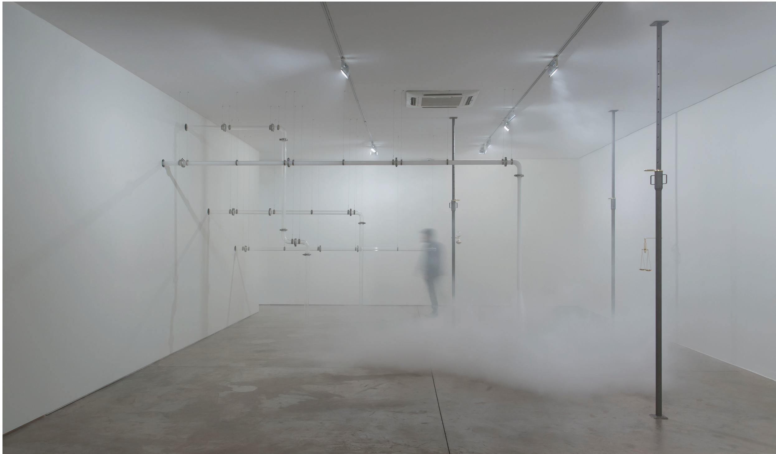
Morro Mundo , 2017 tubos de vidro, máquina de fumaça dimensões variáveis